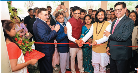
जिससे प्रदेश के लोगों का जीवन स्तर बेहतर हो रहा है। मंत्री श्री चौधरी ने कहा कि छत्तीसगढ़ आज देश के तेजी से प्रगति करने वाले राज्यों में शामिल हो चुका है। उन्होंने कहा कि एक समय जिन चुनौतियों को चर्चा होती थी, आज उन्हें पीछे छोड़ते हुए राज्य

वित्त मंत्री ओपी चौधरी ने कहा कि स्वास्थ्य सुविधाओं का विस्तार किसी भी राज्य के विकास का महत्वपूर्ण आधार होता है। नवा रायपुर में इस आधुनिक अस्पताल की शुरुआत से क्षेत्र के नागरिकों को बेहतर एवं गुणवत्तापूर्ण चिकित्सा सेवाएं स्थानीय स्तर पर उपलब्ध होंगी। उन्होंने कहा कि राज्य सरकार स्वास्थ्य, शिक्षा और अधोसंरचना के क्षेत्र में लगातार कार्य कर रही है, जिससे प्रदेश के लोगों का जीवन स्तर बेहतर हो रहा है।