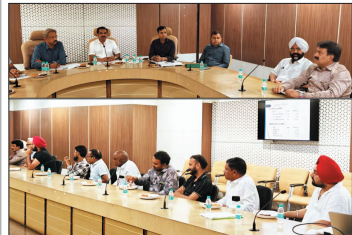
परिवहन सचिव ने ती बस संचालकों व अधिकृत वेहों को बैठक

छत्तीसगढ़ में यात्री सुरक्षा को और मजबूत बनाने के लिए परिवहन विभाग ने बड़ा फैसला लिया है। अब सभी यात्री बसों में वाहन लोकेशन ट्रैकिंग डिवाइस (वीएलटीडी) लगाना और उसे सक्रिय रखना अनिवार्य होगा। निर्धारित समय सीमा के भीतर निचम का पालन नहीं करने वाले बस संचालकों के खिलाफ मोटरघान अधिनियम, 1988 के तहत कार्रवाई की जाएगी।