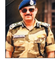
नई दृष्टिबिंदु / भिलाई