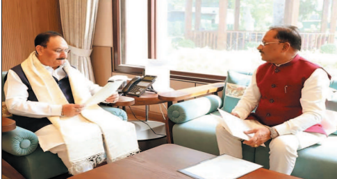
मंत्री को जानकारी दी कि राज्य में किसानों को खाद और बीज की पर्याप्त एवं समय पर उपलब्धता सुनिश्चित करने के लिए स्पष्ट निर्देश जारी किए गए हैं। सरकार यह सुनिश्चित कर रही है कि किसानों को किसी भी प्रकार की परेशानी का सामना न करना पड़े तथा खरीफ सीजन के दौरान आवश्यक कृषि आदानों की आपूर्ति सुचारु रूप से बनी रहे। मुख्यमंत्री श्री साय ने बताया कि अधिकारियों को निर्देश दिए गए हैं कि खाद वितरण व्यवस्था पर सतत निगरानी रखी जाए और किसी भी प्रकार की कालाबाजारी, जमाखोरी अथवा लापरवाही को कर्दाई बर्दशत न किया जाए। साथ ही गांव-गांव

छत्तीसगढ़ के मुख्यमंत्री विष्णुदेव साय ने नई दिल्ली में केंद्रीय स्वास्थ्य एवं परिवार कल्याण तथा रसायन एवं उर्वरक मंत्री जेपी नूतन के कि प्रदेश के पिछड़ा मुलाकात की। इस दौरान जनस्वास्थ्य, चिकित्सा अधोसंरचना, औषधि एवं उर्वरक क्षेत्र सहित विभिन्न विषयों और समसामयिक विषयों पर विस्तृत एवं सार्थक चर्चा हुई। मुख्यमंत्री श्री साय ने केंद्रीय मंत्री को अवगत कराया कि राज्य सरकार स्वास्थ्य सेवाओं के विस्तार और सुदृढीकरण के लिए लगातार कार्य कर रही है। विशेष रूप से दूरस्थ, ग्रामीण और जनजातीय क्षेत्रों तक गुणवत्तापूर्ण स्वास्थ्य सुविधाएं पहुंचाने के लिए अस्पतालों, मेडिकल कॉलेजों और अन्य चिकित्सा संस्थानों को मजबूत बनाया जा रहा है। उन्होंने कहा कि राज्य सरकार का प्रयास है कि प्रदेश के नागरिकों को बेहतर उपचार और आधुनिक स्वास्थ्य सुविधाएं उपभोग करने में सक्षम बनाएं। बैठक के दौरान मुख्यमंत्री ने कृषि और उर्वरक क्षेत्र से जुड़े विषयों पर भी चर्चा की। उन्होंने केंद्रीय