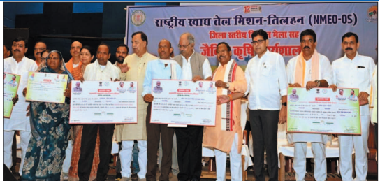
किसानों को आत्मनिर्भर बनाने सरकार प्रतिबद्ध

अगर हम अपनी आने वाली पीढ़ी को एक स्वस्थ और सुरक्षित भविष्य देना है, तो रासायनिक खादों की अंधी दौड़ से बाहर निकलना होगा। भारतीयों की उर्वर शक्तियों और इंसानी सेहत को संवतरे का एकमात्र रास्ता जैविक और प्राकृतिक खेती ही है। यह विचार प्रदेश के कृषि मंत्री रामविचार नेताम ने भाटपारा में आयोजित 'जिला स्तरीय तिलहन मेला सह जैविक कृषि कार्यशाला' के दौरान व्यक्त किए। शासकीय गजानन अग्रवाल स्नातकोत्तर महाविद्यालय के ऑडिटोरियम में संपन्न हुए इस समारोह में राज्यस्य मंत्री टंक राम वर्मा, रायपुरका सांसद श्रीमती लक्ष्मी वर्मा और राज्यस्य लोकसभा सांसद बुजमोहन अग्रवाल भी विशेष रूप से मंच पर मौजूद रहे।