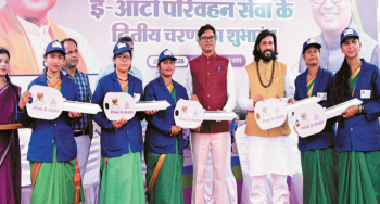
नई दृष्टिबिंदु / रायपुर