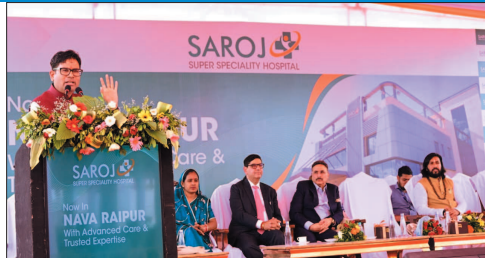
विकास की नई उड़ानों को हुर हुर है। प्रदेश में निवेश बढ़ रहा है, उद्योगों का विस्तार हो रहा है और युवाओं के लिए रोजगार के एक अक्सर सृजित हो रहे हैं। उन्होंने कहा कि स्वास्थ्य क्षेत्र में निजी निवेश और आधुनिक अस्पतालों की स्थापना से नागरिकों को बेहतर सुविधाएं मिलेंगी तथा स्थानीय

के तेजी से प्रगति करने वाले राज्यों में शामिल हो चुका है। उन्होंने कहा कि एक समय जिन चुनौतियों को चर्चा होती थी, आज उन्हें पीछे छोड़ते हुए राज्य