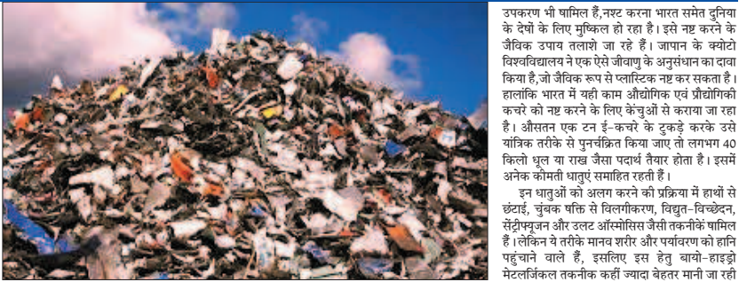
दक्षिण-पूर्व एशिया के विकासशील देश हैं।