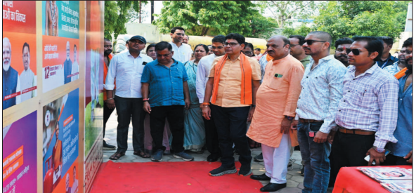
तासीरी में दिल्ली राशक भारत की झलक... प्रदर्शनी में विभिन्न आकारों और चित्रों के माध्यम से देश व राज्य के विकास कार्यों को बेहद आकर्षक ढंग से प्रस्तुत किया गया,

प्रधानमंत्री नरेंद्र मोदी के दूरदर्शी नेतृत्व और केंद्र सरकार के सफल 12 वर्ष पूर्ण होने के उपलक्ष्य में जनसंपर्क विभाग द्वारा नगर भवन बलौदाबाजार में आयोजित तीन दिवसीय भव्य फोटो प्रदर्शनी का गुरुवार को समापन हो गया। प्रदर्शनी के अंतिम दिन प्रदेश के राजस्व मंत्री राजस्व राम वर्मा ने इसका आत्मीय अवलोकन किया। इस दौरान उन्होंने केंद्र व राज्य सरकार की लोक-कल्याणकारी योजनाओं और देश की प्रगति की दृष्टांती तस्वीरों की जमकर सराहना की। राजस्व मंत्री टंक राम वर्मा ने प्रधानमंत्री नरेंद्र मोदी के 12 वर्षों के कार्यकाल को 'ऐतिहासिक' करार दिया। उन्होंने कहा कि प्रधानमंत्री श्री नरेंद्र मोदी के नेतृत्व में बीते 12 वर्षों में देश ने अधोसंरचना विकास (इंफ्रास्ट्रक्चर) से लेकर आर्थिक और तकनीकी सहित हर क्षेत्र में उल्लेखनीय प्रगति की है। इन योजनाओं ने देश को एक नई दशा और दिशा दी है। आज छत्तीसगढ़ के अंतिम व्यक्ति तक शासन की योजनाओं का सीधा लाभ पहुंच रहा है।