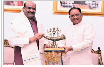
नई दृष्टिबिंदु / रायपुर

लोकसभा अध्यक्ष ओम बिरला ने राजधानी रायपुर स्थित मुख्यमंत्री निवास में मुख्यमंत्री विष्णु देव साय से सौजन्य भेंट की। इस अवसर पर मुख्यमंत्री श्री साय ने शाल एवं स्मृति-चिह्न भेंट कर उनका आत्मीय स्वागत एवं सम्मान किया। साथ ही छत्तीसगढ़ की समृद्ध सांस्कृतिक विरासत और विश्वविख्याता बस्तर दरवार पर आधारित कॉपी टेबल युक्त भी उन्हें भेंट की। मुख्यमंत्री विष्णु देव साय ने लोकसभा अध्यक्ष ओम बिरला के छत्तीसगढ़ आगमन पर स्वागत करते हुए कहा कि लोकतांत्रिक परंपराओं को मजबूत बनाने, संसदीय मर्यादाओं को नई ऊंचाइयों तक पहुंचाने तथा जनप्रतिनिधियों की भूमिका को अधिक प्रभावी बनाने में उनका योगदान प्रेरणादायी है।