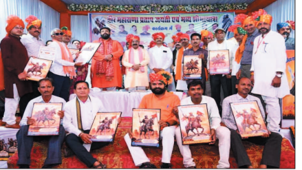
करते हुए ये बातें कही। उन्होंने समारोह में महाराणा प्रताप की अष्टाशत प्रतिमा के निर्माण