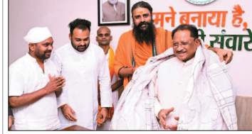
नई दृष्टिबिंदु / रायपुर