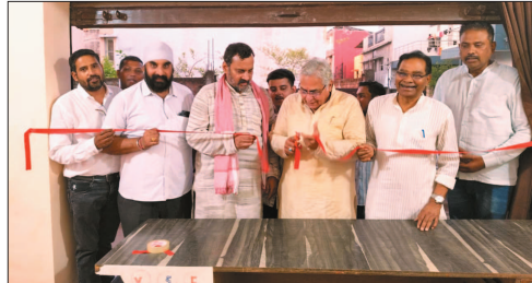
नई दृष्टिबिंदु / दुर्ग-मिलाई के डिजिटल प्लेटफॉर्म का जिला कार्यालय सोमवार को वार्ड-26, तरण टॉकीज के पीछे संतरा बाड़ी दुर्ग में उद्घाटित हुआ।