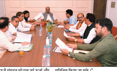
ग्रामीण क्षेत्र में संगठन को एक नई ऊर्जा और सक्रियता के साथ कार्य करना होगा ताकि केंद्र की राष्ट्रीय नीतियों और राज्य सरकार के जनसेवा कार्यों का व्यापक प्रचार-प्रसार सुनिश्चित किया जा सके।