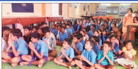
गांव-जिले का नाम रोशन करने के लिए प्रेरित किया। उन्होंने राष्ट्रीय-अंतरराष्ट्रीय स्तर पर पहचान बनाने वाले जिले के प्रतिभाशाली विद्यार्थियों को उदाहरण दिया।