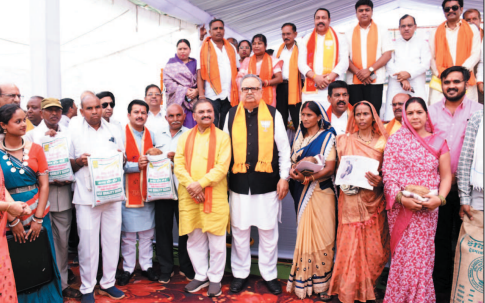
डॉ. रमन सिंह ने कहा कि राजनांदगांव जिले में कृषि गतिविधियों को बढ़ावा देने के उद्देश्य से स्थापित कृषि विज्ञान केन्द्र, सुरगी आज प्रदेश ही नहीं बल्कि देशभर में अपनी विशिष्ट पहचान बना चुका है। यहां छह राज्यों के विद्यार्थी अध्ययन एवं अनुसंधान के लिए आ रहे हैं। उन्होंने बताया कि सुरगी उनका गोद ग्राम है, जहां निरंतर विकास कार्य संचालित किए जा रहे हैं। सुरगी-खरसा डायवर्सन

विधानसभा अध्यक्ष डॉ. रमन सिंह राजनांदगांव जिला के कृषि विज्ञान केन्द्र, सुरगी में आयोजित जैविक कृषि कार्यशाला सह कृषक सम्मेलन में शामिल हुए। इस अवसर पर उनका खुमरी पहनाकर आधुनिक स्वागत किया गया। विधानसभा अध्यक्ष ने कार्यक्रम स्थल पर लगाए गए विभिन्न कृषि एवं जैविक उत्पादों के स्टैंडों का अवलोकन किया तथा उत्पाद कार्यक्रम करने वाले कृषकों को प्रशस्त पत्र प्रदान कर सम्मानित किया। कार्यक्रम को संबोधित करते हुए विधानसभा अध्यक्ष डॉ. रमन सिंह ने कहा कि प्रधानमंत्री नरेंद्र मोदी के नेतृत्व में किसानों के हित में अनेक ऐतिहासिक निर्णय लिए गए हैं। उन्होंने कहा कि वर्तमान में ग्रामीण की जाजर कीमत लगभग 2,220 रुपए प्रति ड्रिगल है, किंतु केंद्र सरकार की सखिडी नीति के कारण किसानों को यह मात्र 266 रुपए में उपलब्ध कराया जा रहा है। उन्होंने कहा कि आज रासायनिक उर्वरकों के कोटनकारकों के अत्यधिक उपयोग से स्वास्थ्य संबंधी गंभीर समस्याएं बढ़ रही हैं। उन्होंने किसानों को जैविक प्राकृतिक खेती की दिशा में प्रोत्साहित करते हुए गहरा खाद एवं जैविक खाद का अधिकधिक उपयोग करना चाहिए।