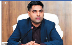
लाभाधारियों को सचिविडी का भुगतान भी किया जा चुका है।