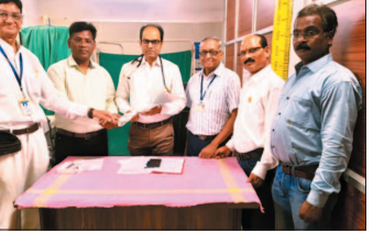
नाक-गला, शल्य चिकित्सा, हड्डी, मसूढ़, मनुचु एवं शिशु विभाग, डायलिसिस, आर्टिसीयू, आपाकालीन सेवाएं, बर्न यूनिट तथा 500 युक्त काला ब्लाड बैंक संचालित है। नव प्रारंभ हृदय रोग विभाग