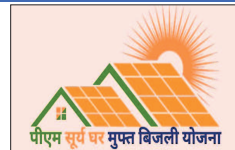
लाभाधारियों को सचिविडी का भुगतान भी किया जा चुका है।