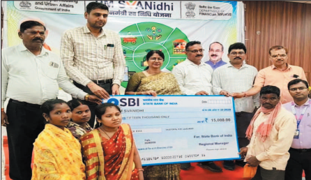
में ऋण स्वीकृति प्रदान की गई। इसके अलावा 5 हितग्राहियों के क्रेडिट कार्ड आवेदन ऑनलाइन दर्ज किए गए। पथ विक्रताओं ने कुल 169 पथ विक्रताओं एवं 27 बैंकों के प्रतिनिधियों ने सहभागिता निभाई। पीएम स्वनिधि योजना के तहत नए ऋण लाभार्थियों की पहचान के लिए बनाए गए विशेष अभियान में 87 नए आवेदकों को ऋण के लिए चिन्हान्वित किया गया। वहीं विभिन्न बैंकों द्वारा 45 हितग्राहियों को ऋण वितरित किया गया तथा 54 प्रकरणों

प्रधानमंत्री स्ट्रीट वेंडर्स आत्मनिर्भर निधि (पीएम स्वनिधि) योजना के अंतर्गत गुम्हार को नगर पालिक निगम दुर्ग के श्रेष्ठ मोतिलाल वीरा सभागार में जिला स्तरीय स्वनिधि महोत्सव का आयोजन किया गया। महोत्सव में बड़ी संख्या में पथ विक्रताओं ने भाग लेकर विभिन्न शासकीय योजनाओं, बैंकिंग सेवाओं तथा सामाजिक सुरक्षा योजनाओं का लाभ प्राप्त किया।