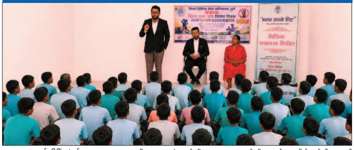
नई दृष्टिविंदु / दुर्ग

विश्व बाल श्रम निषेध दिवस के अवसर पर जिला विधिक सेवा प्राधिकरण दुर्ग द्वारा किशोर न्याय बोर्ड दुर्ग में विशेष विधिक जागरूकता शिविर का आयोजन किया गया। कार्यक्रम में लीगल एंड डिफेंस काउंसिलर सिस्टम के दो कार्यसलर विशेष रूप से उपस्थित रहे, जिन्होंने बच्चों को उनके अधिकार एवं बाल संरक्षण से संबंधित महत्वपूर्ण कानूनी जानकारी प्रदान की।