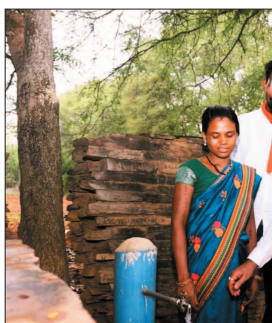
जल जीवन मिशन दूरस्थ गांवों और जंगलों की महिलाओं को जीवन में बड़ा बदलाव ला रहा है। आधी आबादी के एक बड़े हिस्से को पाने के पानी के लिए रोज जुझना पड़ता था। खासतौर से गर्मियों के दिनों में जब हर साल फिर पानी के बर्तन का सफर कुछ सौ मीटरों से कुछ किलोमीटरों में बदल जाता है।

मियों में महिलाओं का जीवन दुष्कर बना देती थी। दुगनापाल में भी महिलाओं को रोज गांव के हैंडपंप या कुआं पर जाकर घर के सभी लोगों के लिए पानी का इंतजाम करना पड़ता था। घर में नल लाने से अब इस समस्या से निजात मिल गई है। जल जीवन मिशन के काम जैसे-जैसे पूरे होते जा रहे हैं, महिलाओं की बाहर से पानी लाने की जगह और तकलीफ दूर हो रही जा रही है। खेती-साग में अब तक आने आने रहने से अधिक