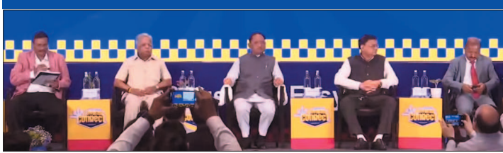
नई दृष्टिबिंदु / हैदराबाद

निवेशकों को दी नई औद्योगिक नीति की जानकारी, 8 लाख करोड़ से अधिक के प्रस्ताव मिले