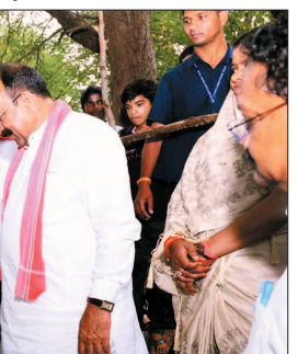
योजनाओं को पूर्ण कर संचालन के लिए पंचायतों को सौंपा जा चुका है।

जल जीवन मिशन महज हर घर तक पेयजल पहुंचाने की योजना नहीं है। यह महिलाओं की दिनचर्या और जीवन में भी बड़ा बदलाव ला रहा है। गांवों में परंपरागत रूप से घर में पेयजल और अन्य जरूरतों के लिए पानी के इंतजाम का जिम्मा महिलाओं पर ही है। घर तक पानी की पहुंच न होने के कारण उन्हें हैंडपंपों, सार्वजनिक नलों,