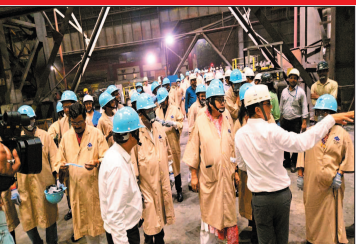
नई दृष्टिबिंदु / भिलाई

ब्लास्ट फर्नेस-8 और यूनिवर्सल रेल मिल का किया जायजा, 260 मीटर लंबी रेल उत्पादन प्रक्रिया देखी