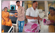
संस्था ही सहारा है।

भूखे को रोटी देना सबसे बड़ा धर्म है। इसी भाव को लेकर जन समर्पण सेवा संस्था पिछले 9 साल 5 महीने, यानी 3440 दिन से बिना एक दिन रुके रोज 170 से ज्यादा जरूरतमंदों को निशुल्क भोजन करा रही है। फुटपाथ, बस स्टैंड, रेलवे स्टेशन पर सोने वाली के लिए यह