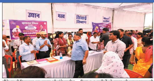
मौके पर ही निराकरण कर शासन की संवेदनशील कार्यपालिका का परिचय दिया गया, जबकि शेष आवेदनों को संबंधित विभागों को निर्धारित समय-सीमा में निराकरण हेतु भेजा गया है। पर्यटन एवं संस्कृति मंत्री राजेश अग्रवाल ने विभिन्न विभागों द्वारा लगाए गए स्टालों का निरीक्षण किया तथा ग्रामीणों को शासन की जनकल्याणकारी योजनाओं की जानकारी उपलब्ध बनाने के प्रयासों की समझना की। उन्होंने कहा कि राज्य सरकार का उद्देश्य केवल योजनाएं बनाना नहीं, बल्कि उनके वास्तविक लाभ को अंतिम व्यक्ति तक पहुंचाना है। मंत्री श्री अग्रवाल ने कहा कि मुख्यमंत्री

हर्षा टिकरा क्लस्टर के अंतर्गत आने वाली 27 ग्राम पंचायतों के ग्रामीणों की बड़ी भागीदारी वाले इस शिविर में कुल 1,153 आवेदन प्राप्त हुए, जिनमें 1,106 मामों संबंधी तथा 47 शिकायत संबंधी आवेदन शामिल रहे। इनमें से 22 आवेदनों को