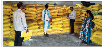
नई दृष्टिविंदु / रायपुर-बिलासपुर

खरीफ सीजन को देखते हुए कृषि विभाग ने खाद की कालाबाजारी, अवैध भण्डारण और निर्यात दर से अधिक मूल्य पर बिक्री करने वालों के खिलाफ सख्त कार्रवाई शुरू कर दी है। सभी जिलों में उड़ते उड़ते गहनतया खानों द्वारा लातार खणभार कार्रवाई की जा रही है। बिलासपुर जिले में महार और सेन्दरी में बड़ी मात्रा में खाद जन्त कर कानूनी कार्रवाई की गई है।