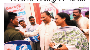
नई दृष्टिविंदु / रायपुर

सुशासन तिहार के अंतर्गत मुख्यमंत्री विष्णुदेव साय सोमवार को कोडगांव जिले के ग्राम पंचायत बड़केनेरा में आयोजित समाधान शिविर में शामिल हुए। इस अवसर पर मत्स्य पालन विभाग द्वारा जिले के मत्स्य पालकों एवं मत्स्य व्यवसाय से जुड़े हितग्राहियों को आजीविका सशक्त बनाने के लिए विभिन्न आधुनिक उपकरण एवं सामग्री प्रदान की गई।