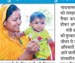
पर रोक लगाने के लिए सभी को मिलकर प्रयास करना होगा।

विश्व बाल सुरक्षा दिवस 1 जून के अवसर पर महिला एवं बाल विकास मंत्री श्रीमती लक्ष्मी राजवाड़े ने प्रदेशवासियों से बच्चों की सुरक्षा, अधिकारों की रक्षा और उनके समग्र विकास के लिए साहसिक जिम्मेदारियों निभाने का आह्वान किया है।