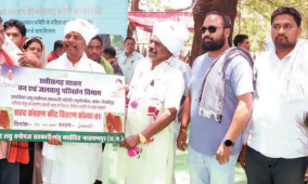
के उद्देश्य से दी गई है। नक्सलमुक्त हो रहे अबुझमाड़ क्षेत्र में महिलाओं को सशक्त करने की दिशा में इसे अहम कदम माना जा रहा है। इन समूहों को दीना-पतल निर्माण, मूडआ पात्र कला, फूलझाड़ू प्रदर्शन, किराना एवं कैटीन संचालन, मिठाई निर्माण, लघु उद्योग प्रसंस्करण, बेकरी संचालन और होटल व्यवसाय जैसे स्वरोजगार से जोड़कर उनकी आजीविका मजबूत करने और आर्थिक रूप से आत्मनिर्भर बनाने