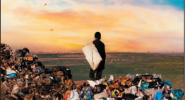
पास की गरीबी आध्यात्मिकता के करीब आई हैं। लेकिन वह हर दिन एक उलटी बात देखकर हमें रहस्य है।

नागरिक जिम्मेदारी पर छिड़ी बहस चलती कार से फेंकी गई प्लास्टिक बोतल। सूरज दुबई के बाद बीए पर बिखरे खाने के शेर। देवी की तरह पूजी जाने वाली नदी के किनारे कपड़े के ढेर। कई भारतीयों के लिए, ये नजारें झटने आम हो गए हैं कि अब वे मुश्किल से ही जगह बने हैं। फिर भी, देश धूमने आने वाले विदेशी टूरिस्ट के लिए, उन्हें अक्सर नजरअंदाज करना नामुमकिन होता है।