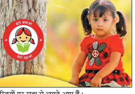
सिखों पर सदा से लाते आए हैं।

तिशा पर्ये कमती थी। नोएडा से भोपाल जाने पर उसने बहुत से काम छूट गए थे। इन्हें पर भी उसे लाने पड़ते थे। यानी कि एक ही पैके कमाए, उसने अपने पति के परिवार को सौंप दे। पर का काम करे। खाना बनाए। सक्की सेवा करे। किसी और से भी बातचीत तक न करे, नहीं तो उसके चरित्र पर सवाल उठाने का अधिकार, हर एरे-नरे मुँख खैरे को मिल जाएगा। कई वकीलों ने कहा भी कि आरोप तो वे