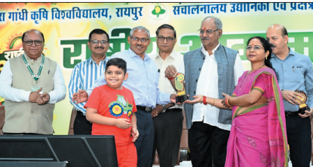
आम प्रदर्शनी में शामिल विभिन्न श्रेणियों के उत्कृष्ट प्रदर्शनों को किया गया पुरस्कृत