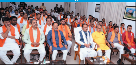
मुख्यमंत्री साय ने कहा - यह प्रदेश की प्रतिभा और विरासत को राष्ट्रीय सम्मान मिलने का क्षण

मुख्यमंत्री विष्णुदेव साय ने राजधानी रायपुर स्थित अपने निवास कार्यालय में जनप्रतिनिधियों, गणमान्य नागरिकों और आमजनों के साथ प्रथममंत्री नरेंद्र मोदी के लोकप्रिय रैंडियों कार्यक्रम मन की बात को 134वाँ कड़ी का श्रवण किया। कार्यक्रम के उपरांत मुख्यमंत्री श्री साय ने कहा कि आज का मन की बात छत्तीसगढ़ के लिए अत्यंत बड़ा, प्रेरणा और आत्मविश्वास का क्षण बन गया, क्योंकि प्रधानमंत्री नरेंद्र मोदी ने राष्ट्रीय स्तर पर प्रदेश की प्रतिभा और सांस्कृतिक धरोहर दोनों को उल्लेख कर पूरे छत्तीसगढ़ का सम्मान बढ़ाया है। मुख्यमंत्री श्री साय ने कहा कि जब चुका का सर्वोच्च नेतृत्व किसी राज्य की उपलब्धियों और प्रतिभाओं का उल्लेख करता है, तो वह केवल व्यक्तिगत का सम्मान नहीं होता, बल्कि करोड़ों प्रदेशवासियों की आकांक्षाओं, परिश्रम और पहचान को राष्ट्रीय प्रतिष्ठा मिलती है।