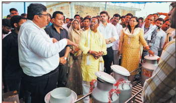
नई दृष्टिबिंदु / रायपुर

बलरामपुर जिले के पशुपालकों को आर्थिक रूप से सशक्त बनाने तथा दुग्ध उत्पादन को बढ़ावा देने की दिशा में एक महत्वपूर्ण पहल की गई। आदिम जाति विकास, कृषि विकास एवं किसान कल्याण तथा जैव प्रौद्योगिकी, मछलीपालन एवं पशुधन विकास विभाग मंत्री रामविचार नेताम ने दूध ग्राम महावीरगंज में राष्ट्रीय डेयरी विकास बोर्ड के द्वारा स्थापित दुग्ध शीतलक केंद्र का शुभारंभ किया गया। इस अवसर पर उन्होंने नवीन पशु औषधालय का भी औपचारिक शुभारंभ किया। महावीरगंज में दुग्ध शीतलक केंद्र और नवीन पशु औषधालय की सौगात से क्षेत्र के पशुपालकों को दुग्ध विपणन, पशु उपचार और आम वृद्धि की बेहतर सुविधाएं उपलब्ध होंगी।