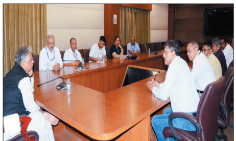
के माध्यम से किसानों के सामाजिक-आर्थिक सशक्तिकरण में योगदान दे रहे हैं। मंत्री जी कृषि आय में सुधार और जनजातों पर विपणन के अनुकूल कृषि पद्धतियों को मजबूत करने के उद्देश्य से संस्थान की पहलों से भी अवगत करवाया गया।