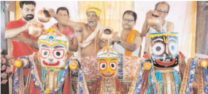
नई दृष्टिबिंदु / भिलाई