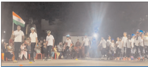
स्मृति नगर में निःशुल्क समर कैंप का रंगारंग समापन