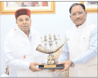
नई दृष्टिबिंदु / रायपुर

मुख्यमंत्री विष्णुदेव साय से आज राजधानी स्थित मुख्यमंत्री निवास में कर्नाटक के राज्यपाल थावरचंद महलोल ने सौजन्य भेंट की। छत्तीसगढ़ प्रवास पर आए राज्यपाल महलोल का मुख्यमंत्री साय ने आभार व्यक्त किया। इस अवसर पर मुख्यमंत्री ने राज्यपाल को बस्तर की समृद्ध कला और सांस्कृतिक विरासत के प्रतीक के रूप में बस्तर आर्ट का प्रतीक चिह्न भेंट किया। भेंट के दौरान दोनों के बीच विभिन्न सामाजिक विषयों और जनहित से जुड़े मुद्दों पर आत्मीय चर्चा हुई।