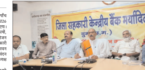
उन्होंने बताया कि भारत सरकार के निर्देशानुसार पूरे