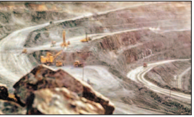
कनका नदी अर्थात् हाल ही में महाराष्ट्र के गढ़चिरोली में एक नया तहसीलदार पर हमला कर रहे हैं। यह स्थिति दर्शाती है कि अवैध खनन केवल आर्थिक अपराध नहीं, बल्कि कानून के शासन और लोकतांत्रिक संस्थाओं के लिए भी चुनौती बन चुका है।

वैश्विक स्तर पर भारत प्राकृतिक संसाधनों की दृष्टि से विश्व के सबसे समृद्ध देशों में से एक रहा है। रेत, मुग्न, मिट्टी, पथर, मिट्टी और अन्य गणित खनिजों ने न केवल देश के निर्माण क्षेत्र को प्रति दी है बल्कि ग्रामीण और शहरी विकास की आधारशिला भी रखी है। किंतु पिछले कुछ दशकों में जिस तीव्र गति से इन संसाधनों का दोहन हो रहा है, उसने एक गंभीर राष्ट्रीय संकट को जन्म दिया है। यह संकट केवल अर्थव्यवस्था तक नहीं सीमित नहीं है, बल्कि पारिस्थितिक विनाश, प्रासासिक प्रथाओं व राजनीतिक संरक्षण का सबसे बड़ा जीवित उदाहरण राज्य ह्रास और भविष्य की पीढ़ियों के अधिकारों से सतत ह्रास प्रारंभ बन चुका है।