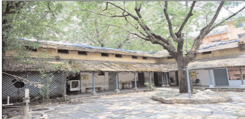
नई दृष्टिबिंदु / दुर्ग

कार्यालय भवन का शीघ्र ही नवनिर्माण किया जाएगा। लंबे समय से जिले की शिक्षा व्यवस्था के संचालन का केंद्र रहे इस ऐतिहासिक भवन को आधुनिक सुविधाओं से युक्त नए स्वरूप में