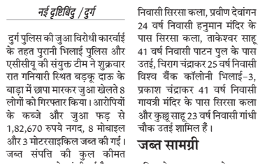
1.82 लाख नगद समेत 5.20 लाख की संगति जब्त

दुर्ग पुलिस की जुआ विरोधी कार्रवाई के तहत पुरानी भिलाई पुलिस और एसीसीयू की संयुक्त टीम ने शुक्रवार रात गिनियारी स्थित बड़कु दारक के बाड़ा में छापामारक जुआ खेलते 8 लोगों को गिरफ्तार किया। आरोपियों के कब्जे और जुआ अड्डे से 1,82,670 रुपये नगद, 8 मोबाइल और 3 मोटरसाइकिल जब्त की गई। जल संगति की कुल कीमत 5,20,170 रुपये आंकी गई है। पुलिस को 27 जून को रात मुख्तार से सूचना मिली थी कि थाना पुरानी भिलाई-3 क्षेत्र के ग्राम गिनियारी, भिलाई-3 स्थित बड़कु दारक की बाड़ी में बने मकान के अंदर कुछ दर्ज कर जांच की जा रही है। दुर्ग पुलिस ने बताया कि अद्वैत जुआ, सट्टा और अन्य आसाराधिक गतिविधियों के विरुद्ध विशेष अभियान चलाकर जारी है। पुलिस ने आम नागरिकों से अपील की है कि ऐसी गतिविधियों से दूर रहें और जानकारी मिलने पर तत्काल पुलिस को सूचित करें। कानून का उल्लंघन करने वालों पर सख्त कार्रवाई की जाएगी।