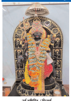
नई दृष्टिबिंदु / मिलाई