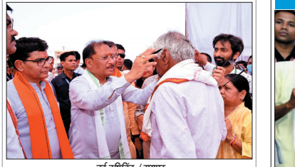
नई दृष्टिबिंदु / रायपुर