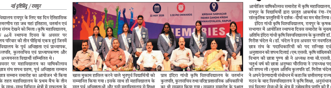
नई दृष्टिबिंदु / रायपुर

कृषि महाविद्यालय रायपुर के लिए यह दिन ऐतिहासिक तथा अविस्मरणीय रहा जब यहां इतिहास, वर्तमान एवं भविष्य का संगम देखने को मिला। कृषि महाविद्यालय, रायपुर के 66वें स्थापना दिवस के अवसर पर महाविद्यालय परिवार की तीन पीढ़ियां एकत्र हुईं जिन्हें कृषि महाविद्यालय के पूर्व अधिष्ठाता एवं प्राध्यापक, वर्तमान कुलपति, कुलसचिव एवं प्राध्यापकगण और विद्यार्थी ने अत्यन्त रंगारंग सांस्कृतिक कार्यक्रमों के माध्यम से समारोह का आयोजन भी किया गया जिसके तहत महाविद्यालय के प्रथम बैच के तीन विद्यार्थियों के साथ-साथ विभिन्न क्षेत्रों में सफलता के कृषि महाविद्यालय रायपुर के लिए यह दिन ऐतिहासिक तथा अविस्मरणीय रहा जब यहां इतिहास, वर्तमान एवं भविष्य का संगम देखने को मिला। कृषि महाविद्यालय, रायपुर के 66वें स्थापना दिवस के अवसर पर महाविद्यालय परिवार की तीन पीढ़ियां एकत्र हुईं जिन्हें कृषि महाविद्यालय के पूर्व अधिष्ठाता एवं प्राध्यापक, वर्तमान कुलपति, कुलसचिव एवं प्राध्यापकगण और विद्यार्थी ने अत्यन्त रंगारंग सांस्कृतिक कार्यक्रमों के माध्यम से समारोह का आयोजन भी किया गया जिसके तहत महाविद्यालय के प्रथम बैच के तीन विद्यार्थियों के साथ-साथ विभिन्न क्षेत्रों में सफलता के