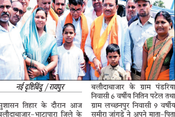
नई दृष्टिबिंदु / रायपुर