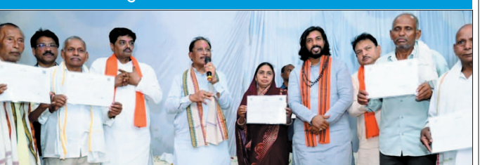
नई दृष्टिबिंदु / रायपुर