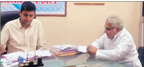
पानी की भारी किल्लत झेल रहे हैं। आम नागरिक अपनी दैनिक दिनचर्या तक नहीं चला पा रहे हैं और पूरा जनजीवन प्रभावित हो चुका है।

वोरा ने कहा कि यह अत्यंत दुर्भाग्यपूर्ण स्थिति है कि चार लाख लोगों की प्यास बुझाने वाली विशाल शिथाना नदी होने के बावजूद दुर्ग शहर में पानी के लिए हाहाकार मचा हुआ है। दुर्ग शहर में लगभग 60 बड़े वार्ड हैं, मात्र 15 टैंकरों के भारसे पूरे शहर की जलापूर्ति कैसे की जा रही है, इसका जवाब प्रशासन ही दे सकता है। हालात यह हैं कि लोगों को कई बार गुस्सा लगने के बाद टैंकर पहुंच पा रहे हैं। पिछले डेढ़ महीने से हरिनगर वार्ड क्रमांक 59 सहित कई क्षेत्रों में लोग