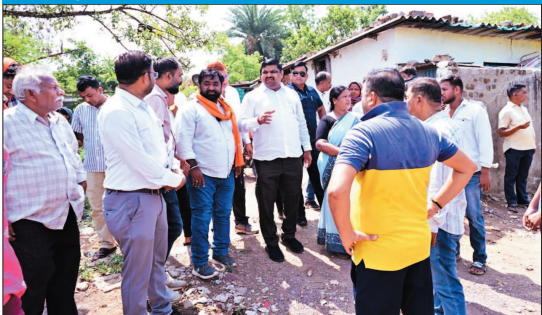
नई दृष्टिबिंदु / दुर्ग

बारिश पूर्व नालियों की सफाई में तेजी लाने को कहा, बोले- अंतिम व्यक्ति तक पहुंचे सुविधाएं