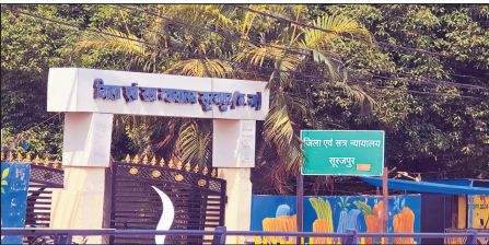
नई दृष्टिबिंदु / रायपुर

नए कानून बीएनएस के बाद गवाहों के पलटने पर भी वैज्ञानिक साक्ष्यों से हो रही सजा