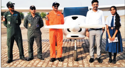
देखते ही बन रही थी। दरअसल, विद्यार्थियों के चयन के लिए 13 मई को जिला स्तरीय

2 छोटे शहरों और गांवों के बच्चों के सपनों को नई उड़ान देने की दिशा में जिला प्रशासन सकी की एक अग्रणी पहल सामने आई है। प्रशासन ने जिले के 24 मेधावी छात्र-छात्राओं को एयरपोर्ट भ्रमण करके न केवल उन्हें आधुनिक उड़न व्यवस्था से परिचित कराया, बल्कि उनके भीतर बड़े सपने देखने का आत्मविश्वास भी जगाया। इस विशेष शैक्षणिक भ्रमण में बच्चों के लिए यादगार अनुभव का रूप ले लिया। एयरपोर्ट और फाइटर प्लेन को अब तक केवल किताबों, फिल्मों या टीवी स्क्रीन पर देखने वाले विद्यार्थियों ने जब उन्हें सामने से देखा, तो उनकी उत्सुकता और खुशी