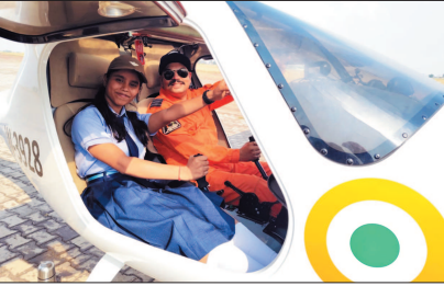
सामान्य ज्ञान एवं एंटी-यूड ट्रेट आभाषित प्रतियोगिता परीक्षा आयोजित की गई थी। इसमें उत्कृष्ट प्रदर्शन करने वाले 24 छात्र-छात्राओं को एयरपोर्ट भ्रमण के लिए चुना

विद्यार्थियों को बस के माध्यम से स्वामी विवेकानंद विमानतल माना, रायपुर के लिए रवाना किया गया। एयरपोर्ट पहुंचने पर विद्यार्थियों को विमानतल परिकरों का विस्तृत भ्रमण कराया गया। इस दौरान फ्लाईंग ऑफिसर और तकनीकीयन ने बच्चों को फाइटर प्लेन एवं सिविलियन एयरक्राफ्ट की कार्यवाहनी की जानकारी दी। उन्होंने विमान के विभिन्न हिस्सों, डिजाइन और उड़ान प्रणाली को बेहतर सरल तरीके से समझाया।