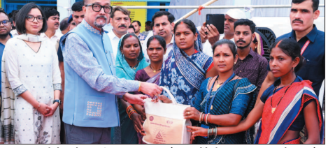
नई दृष्टिबिंदु / रायपुर

राज्यपाल श्री डेका ने कहा कि हर घर में एक कोना सिर्फ पढ़ाई के लिए होना चाहिए। तभी बच्चे शिक्षा के क्षेत्र में आगे बढ़ पाएंगे। उन्होंने अभिभावकों से कहा कि भले ही वे स्वयं स्कूल नहीं जा पाए हों, लेकिन अपने बच्चों को अच्छी शिक्षा के लिए जरूर स्कूल भेजें। उन्होंने शिक्षा दूत के रूप में कार्य कर रहे शिक्षकों और युवाओं से कहा कि वे ड्राइव आउट बच्चों की भी फिटर से स्कूल से जोड़ने का प्रयास करें। उन्होंने विद्यार्थियों को घर और आसपास साफ-सफाई रखने के लिए जागरूक किया और कहा कि नई पीढ़ी को स्वच्छता और स्वास्थ्य के प्रति सजग बनना जरूरी है। उन्होंने कहा कि प्रधानमंत्री जनम योजना का उद्देश्य विशेष पिछड़ी जनजातियों के जीवन स्तर और औसत आयु में सुधार लाना है। इस दौरान बैगा छात्रा समूहों ने बताया कि उनसे 12 वीं कक्षा में 88 प्रतिशत अंक प्राप्त किए हैं और वर्तमान में नीट की तैयारी कर रहे हैं। वहीं गायत्री मोरारवी ने बीएससी नर्सिंग करने की इच्छा जताई। शिक्षा दूत के रूप में कार्य कर रहे निदेशक बैगा ने बताया कि ये बैगा बच्चों को निरमल रूप से स्कूल आने और पढ़ाई के लिए प्रेरित करते हैं। राज्यपाल श्री डेका ने कहा कि यह गर्व की बात है कि अब बैगा समाज के बच्चे शिक्षा के क्षेत्र में आगे बढ़ रहे हैं। डॉक्टर, नर्स और अन्य क्षेत्रों में जाने का सपना देख रहे हैं। उन्होंने बच्चों को भी प्रेरित कर रहे हैं। उन्होंने कहा कि शासन द्वारा हर संभव सहयोग प्रदान किया जाएगा।