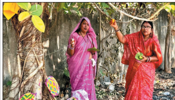
नई दृष्टिदृष्टि / दुर्ग

वट सावित्री व्रत के अवसर पर न्यू आदर्श नगर, जॉन-3 मार्ग क्रमांक 8 में शनिवार को सुहागिन महिलाओं द्वारा श्रद्धा एवं आस्था के साथ व्रत एवं पूजा-अर्चना की गई। महिलाओं ने वट (दारुद) वृक्ष की विधि-विधान से पूजा कर अर्घ्य भी शामिल हुए। कार्यक्रम में सहित