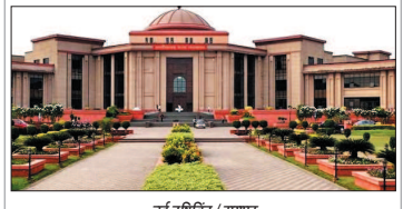
नई दृष्टिबिंदु / रायपुर

गोधाम को लेकर हाईकोर्ट की सरकार को फटकार, कांग्रेस बोली: दावे कागजी, जमीनी हकीकत अलग