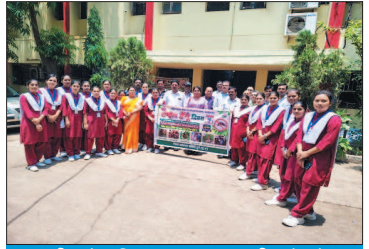
राष्ट्रीय डेगू दिवस 2026 का थीम है "डेगू नियंत्रण में सामुदायिक भागीदारी जांच करें, सफाई करें, और ढंके"