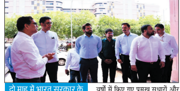
दो माह में भारत सरकार के अधिकारियों का तीसरा दौरा, साचि ने की सारनाह