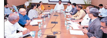
नई दृष्टिबिंदु / रायपुर

निदेश दिए। बैठक में सार्वजनिक वितरण प्रणाली के अंतर्गत अप्रैल, मई एवं जून 2026 के लिए तीन माह के एकमुश्त चावल भंडारण एवं वितरण योजनाओं, धान उठाव, कस्टम मिलिंग तथा सार्वजनिक वितरण प्रणाली से जुड़े विभिन्न विषयों की विस्तृत समीक्षा की। बैठक में मुख्य वर्य 2025-26 में समर्थन मूल्य पर खरीद गए धान के निराकरण, धान खरीदी केन्द्रों एवं संग्रहाण केन्द्रों से धान के उठाव, कस्टम मिलिंग एवं एफपीओ तथा नागरिक आपूर्ति निगम, राज्य भंडार गृह निगम तथा छत्तीसगढ़ राज्य उपभोक्ता विवाद प्रतिक्रिया आयोग में अधिकारियों एवं कर्मचारियों के रिक्त पदों पर भर्ती प्रक्रिया की स्थिति की भी समीक्षा की गई। उन्होंने आश्चर्यचकित पर शीर्ष प्राथमिकता आता बढ़ाने के निर्देश दिए। राज्य में खद्यान भंडारण क्षमता की समीक्षा के तहत मृदा एवं पंजी बचत ने छत्तीसगढ़ राज्य भंडार गृह निगम द्वारा निर्माणधीन गोदामों की निष्पत्ति समर्थन-सीमा में पूर्ण कर उपयोग में लाने के निर्देश दिए।