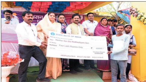
जनप्रतिनिधियों और प्रशासनिक अधिकारियों की मौजूदगी में आयोजित इस शिविर में विभिन्न शासकीय योजनाओं के अंतर्गत क्षेत्र के संकेदों हितग्राहियों को लाभान्वित किया गया।

मौके पर विभागीय अधिकारियों द्वारा 165 आवेदनों का निराकरण किया गया। सेष लंघित आवेदनों के निराकरण के लिए सम्य-सोमा निर्धारित की गई है। सुशासन शिविर में क्षेत्र की जनता ने उत्साहपूर्वक भाग लिया। शिविर में क्षेत्र के 14 ग्राम पंचायत क्रमशः मलपुरीकला, अकोला, कपसदा, ओटेबंद, क्रोधी, अखोटी, हौर (हिं), बोरसी, खपरी, पंचदेवरी, दावा, मुर्, सोरवार और कंडरका के लोगों ने उत्साहपूर्वक अपनी भागीदारी निभायी। स्थानीय