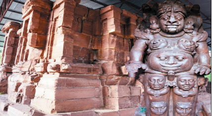
नई दृष्टिबिंदु / रायपुर

छत्तीसगढ़ की हृदयस्थली में बिलासपुर जिले में बसा ताता केवल एक पुरातत्व स्थल नहीं है, बल्कि भारतीय स्थापत्य कला की उस परकाष्ठा का प्रमाण है, जहाँ पथर बोलते हैं। रायपुर-बिलासपुर राजमार्ग पर मनिवारी नदी के तट पर स्थित देवराणी-जेठानी मंदिर अपनी अद्वितीय