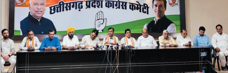
छत्तीसगढ़ प्रदेश कांग्रेस कमेटी