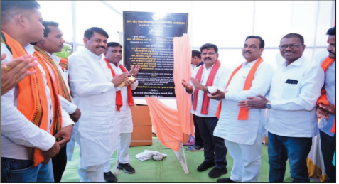
उप मुख्यमंत्री श्री शर्मा ने कहा कि राज्य सरकार शहरी और ग्रामीण क्षेत्रों में विद्युत व्यवस्था को आधुनिक और दृढ़ बनाने के लिए तेजी से काम कर रही है। उन्होंने कहा कि नया विद्युत उपकेंद्र शुरू होने से आसपास के क्षेत्रों को बेहतर एवं निर्यात बिजली आपूर्ति मिल सकेगी। इस परियोजना से कवर्धा शहर के 13 वार्डों के लगभग 8 हजार 614 उपभोक्ता सीधे लाभान्वित होंगे। उन्होंने कहा कि राज्य सरकार बनने के बाद पिछले दहाई वर्षों में जिले में विद्युत अधोसंरचना को मजबूत करने के लिए लगातार कार्य किए गए हैं। दलदली, सेमो और संरचना में नए उपकेंद्रों का भूमिपूजन पहले ही किया जा चुका है तथा दुबहा में भी जल्द नए उपकेंद्र का भूमिपूजन किया जाएगा। उन्होंने बताया कि जिले में पांच नए सब स्टेशन स्थापित करने की दिशा में तेजी से कार्य

मुख्यमंत्री विष्णु देव साय के नेतृत्व में प्रदेश में विद्युत अधोसंरचना को मजबूत बनाने और आम नागरिकों को गुणवत्तापूर्ण बिजली सुविधा उपलब्ध कराने के लिए लगातार व्यापक कार्य किए जा रहे हैं। इसी कड़ी में कवीरधाम जिले के कवर्धा शहर में बढ़ती विद्युत मांग को देखते हुए घोटिया स्थित नवीन बस स्टैंड के पास 33/11 केनली विद्युत उपकेंद्र का निर्माण किया जाएगा। उप मुख्यमंत्री एवं गृह मंत्री विजय शर्मा ने मुख्यमंत्री अर्थोसंरचना विभाग योजना अंतर्गत लगभग 2.06 करोड़ रुपये की लागत से बनने वाले इस उपकेंद्र का भूमिपूजन किया।