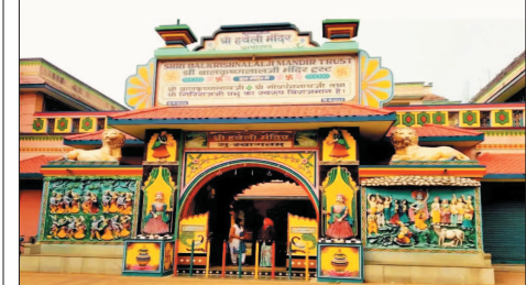
नई दृष्टिबिंदु, रायपुर

चंपारण्य वाम छत्तीसगढ़ की धार्मिक, सांस्कृतिक और आध्यात्मिक परंपरा का एक ऐसा पुराना केंद्र है, जहां भक्ति, इतिहास और प्रकृति का अद्भुत संगम देखने को मिलता है। धार्मिक मान्यताओं के समीप स्थित यह वाम महान वैष्णव संन्यास महापुरुष वल्लभार्य की जन्मस्थली के रूप में पूरे देश में प्रसिद्ध है। आध्यात्मिक ऊर्जा से भरपूर यह स्थान वर्ष भर श्रद्धालुओं और पर्यटकों को अपनी ओर आकर्षित करता है।