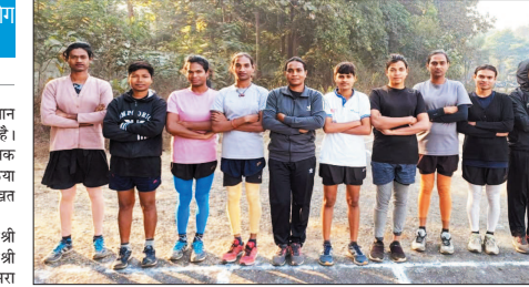
अस्सीकायता और अनेक व्यक्तिगत संघर्षों के बावजूद इन सभी ने अपने आत्मविश्वास और मेहनत के दम पर यह मुकाम हासिल किया।

छत्तीसगढ़ राज्य ने सामाजिक समावेशन और समान अवसर को दिशा में एक महत्वपूर्ण उपलब्धि दर्ज की है। राज्य में 8 ट्रांसजेंडर उम्मीदवारों का चयन पुलिस आरक्षक पद पर हुआ है। यह सफलता वर्ष 2024 की भर्ती प्रक्रिया तथा 2025 में आयोजित शारिरीक दक्षता एवं लिखित परीक्षा में उल्लेख प्रदर्शन के आधार पर मिली है।