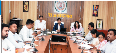
तिलहन खरीदी हो। ग्रीष्मकालीन फसल के लिए बाजार और खाद-बीज का भंडारण रखें। राज्य सरकार एक माह में

जमीन अधिग्रहण का मुआवजा प्रार्थिकाता से दे। पीएम-आशा योजना में पंजीकृत किसानों से शा-तिलहन दलहन-