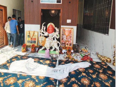
नई दृष्टि बिंदु / भिलाई