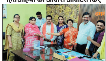
नई दृष्टि बिंदु / दुर्ग

नगर पालिक निगम द्वारा प्रधानमंत्री आवास योजना अंतर्गत शहर के विभिन्न आवास स्थलों पर निर्मित मकानों के आवंटन की प्रक्रिया के दौरान लगातार जारी है। निगम क्षेत्र के सरस्वती नगर, मां कर्मा बोरीसी नगर, जिस्से पुरी प्रक्रिया को अहर्षक किराफायती एवं आवश्यकताओं के लिए शहरवासियों में उरसाह देखा जा रहा है और बड़ी संख्या में आवेदन प्राप्त हो रहे हैं।