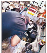
नई दृष्टिबिंदु / रायपुर

अनहोनी की आशंका होने पर पुलिस को सूचना दी गई। पुलिस और FSL की टीम मौके पर पहुंची: सूचना मिलते ही डीडी नगर थाना पुलिस मौके पर पहुंची और जांच शुरू की। मामले की गंभीरता को देखते हुए त्तर और क्राइम ब्रांच की टीम को भी बुलाया गया। टीम ने घटनास्थल से साक्ष्य जुटाए। पुलिस ने शव को पोस्टमार्टम के लिए भेज दिया है।