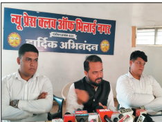
नई दृष्टि बिंदु / भिलाई

कार्यक्रम में सेंट्रल बैंक डिजिटल करेसी को