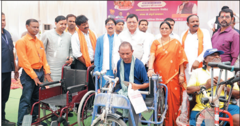
एक मई से 10 जून तक सुशासन तिहार का आयोजन किया जा रहा है। ग्रामीण और शहरी क्षेत्रों में सुशासन तिहार अन्तर्गत अलग अलग शिविर

मुख्यमंत्री विष्णु देव साय के निर्देशन में जिले में सुशासन तिहार मनाया जा रहा है। इस कड़ी में परिवहन नगर वार्ड के नगर अंतर्गत शहरी वार्डों की समस्याओं के निराकरण के लिए जनसमस्या निवारण शिविर का आयोजन ट्रांसपोर्ट नगर में किया गया। इस अवसर पर मुख्य अतिथि के रूप में कोरवा के विधायक और प्रदेश के उद्योग, वाणिज्य, श्रम मंत्री लखनलाल देवांगन शामिल हुए। उन्होंने स्ट्रोल कार अचलकाम कर हितग्राहियों को सहायता के योजनाओं से लाभान्वित किया। नगर पालिक निगम अंतर्गत ट्रांसपोर्ट नगर जोन कार्यालय में वार्ड के अंतर्गत जनसमस्या निवारण शिविर का आयोजन किया गया। इस अवसर पर मंत्री श्री देवांगन ने अपने सम्बोधन में कहा कि मुख्यमंत्री विष्णु देव साय के निर्देशन में प्रदेश में