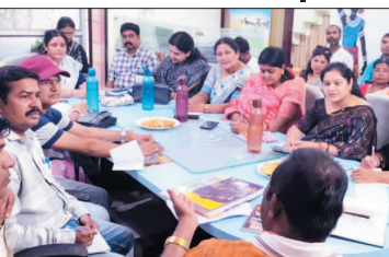
नई दृष्टि बिंदु / दुर्ग

राष्ट्रीय स्वयंसेवक संघ के आर्थिक क्षेत्र में कार्यरत अनुसंगिक संगठन स्वदेशी जागरण मंच द्वारा युवाओं को स्व-उद्यमिता की दिशा में प्रेरित एवं सक्षम बनाने के उद्देश्य से लगातार कार्य किए जा रहे हैं। इसी कड़ी में हाल ही में जगदलपुर में इन्वोवेशन महाकुंज 1.0 का आयोजन संचालित हुआ, जिसमें बस्तर के सुदूर वनांचल क्षेत्रों से आए 1743 युवा छात्र-छात्राओं एवं 200 पुर्नवासित नक्सलियों ने भाग लेकर प्रशिक्षण प्राप्त किया। कायस्थाला के उद्घाटन सत्र में छत्तीसगढ़ के महामहिम राज्यपाल उपस्थित रहे, जबकि समापन सत्र में मुख्यमंत्री ने सहभागिता की। इसके साथ ही प्रदेश सरकार के तीन कैबिनेट मंत्रियों ने भी कार्यक्रम में अपनी उपस्थिति दर्ज कराई। प्रशिक्षण एवं मार्गदर्शन हेतु Indian Institute of Technology Roorkee सहित विभिन्न