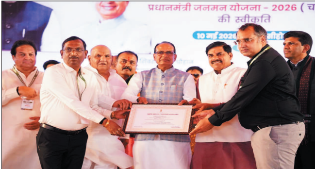
पुरस्कार ग्रहण किया।