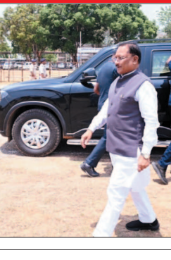
इसी के तहत राज्य शासन शासकीय स्तर पर ईंधन खपत कम करने की ठोस पहल कर रहा है। सीएम साय ने बताया कि अब उनके आधिकारिक भ्रमण के दौरान काफिले में केवल अत्यावश्यक वाहन ही शामिल कर जाएंगे। मंत्रियों और रिगम-मंडलों के पदाधिकारियों से भी सरकारी संसाधनों के संवर्धित उपयोग का आग्रह किया गया है।

मुख्यमंत्री विष्णुदेव साय ने प्रदेशवासियों से ईंधन संरक्षण और संसाधनों के संवर्धन उपयोग का आह्वान किया है। उन्होंने कहा कि ऊर्जा संरक्षण की दिशा में उदाया गया हर कदम राष्ट्रनिर्माण में योगदान है। सीएम साय ने प्रधानमंत्री नरेंद्र मोदी के आह्वान का समर्थन करते हुए इसे राष्ट्रीय दायित्व बताया।