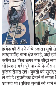
रायपुर / राजधानी रायपुर के शंकर नगर में सुबह-सुबह उभर कर मची अफसा-तफरी