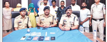
नई दृष्टि बिंदु / दुर्ग

थाना जामुल क्षेत्र में सूने मकानों में चोरी करने वाले अंतरजिला गिरोह का दुर्ग पुलिस ने खुलासा किया है। पुलिस ने मुख्य आरोपी समेत 6 आरोपियों और एक विधि विरुद्ध बालक को गिरफ्तार किया है। इनके पास से करीब 5 लाख रुपये के सोने-चांदी के जेवर, नगदी, टीवी और अन्य सामान बरामद हुए हैं।