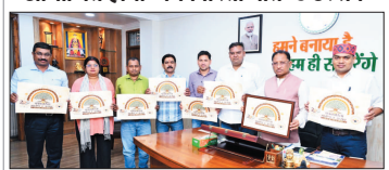
मुख्यमंत्री विष्णु देव साय ने किया उत्सव पोस्टर का विमोचन, सफल आयोजन की दी शुभकामनाएं