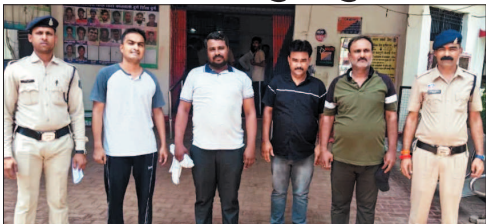
मैच चैनल और दिल्ली के बीच खेले जा रहे मुकाबले में मोबाइल फोन एवं ऑनलाइन एप के माध्यम से हार-जीत का दांव लगाकर ऑनलाइन सट्टा संचालित कर रहा है। सूचना पर पुलिस टीम ने तत्काल मौके पर पहुंचकर घेरावों की और कार्रवाई की। मौके पर तीन व्यक्ति को मोबाइल