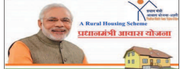
नई दृष्टि बिंदु / दुर्ग