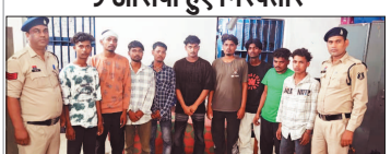
दुर्ग। गंगा नगर दुर्ग में पुराने विवाद और छेड़छाड़ की बात को लेकर हुई मारपीट में पुराने विवाद की हत्या कर दी गई। मामले में पुलिस ने त्वरित कार्रवाई करते हुए 9 आरोपियों को गिरफ्तार कर लिया है। एक अन्य घायल का अस्पताल में इलाज चल रहा है।