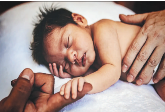
रिश्तों का कोई विकल्प नहीं हो सकता है, लेकिन तालकालिक कर तौर पर वे इनकी उपरिस्थिति में कुछ सुकून हासिल कर सकें हैं। हालाँकि, ऐसे दौर में जब उम्र-दराज लोगों के आय

जीवन की सांझ में बुजुर्गों को अपना के पास न होने की टीस खालती है। कई बुजुर्गों के बच्चे विदेशों में अपना भविष्य तलाशने गए तो फिर लौटकर नहीं आये। जीवनभर की जमा-पूँजी से बनाने गए बड़े-बड़े घरों में वे सिर्फ दीवारें ताकते हैं। बच्चों के पास जाते भी हैं तो वहाँ रात-दिन काम में जुटे बच्चों के साथ रहना उन्हें नजर नहीं आता। आत्मकेन्द्रित हीती पीढ़ी भी भारत में रहने वाले माता-पिता की सुख लेने लौटकर तक नहीं आती। ऐसे में साधन-संपन्न बुजुर्गों को कई बड़े शहरों में ऐसी कंपनियाँ किराये की संतानें उपलब्ध कराती हैं। ये किराये की संतानें बुजुर्गों के साथ सैर पर जाते हैं, लुटे आदि खेले खेलते हैं और उनका एकानोकर नूर करती हैं। यद्यपि यह समस्या का अंतिम समाधान तो नहीं है लेकिन कुछ समय के लिए वे राहत महसूस करते हैं। दरअसल, बुजुर्गों के जीवन में अंदर से खालीपन इतना बढ़ गया है जिसे भरने के लिए वे किराये की संतानों की ओर उन्मुख होते हैं। कई कंपनियाँ बुजुर्गों को केयर का पैकेज देती हैं। वे ऐसे अटेंडेंट उपलब्ध कराती हैं जो बुजुर्गों के साथ बैठकर टीवी देखते हैं, ताख खोलते हैं, दिन-भर बात करते हैं। कंपनियों की यह सुविधा सिर्फ शहरों तक सीमित नहीं रह गई बल्कि गाँवों तक लोग इन्हें अनुभवित कर रहे हैं। हालाँकि, खून के