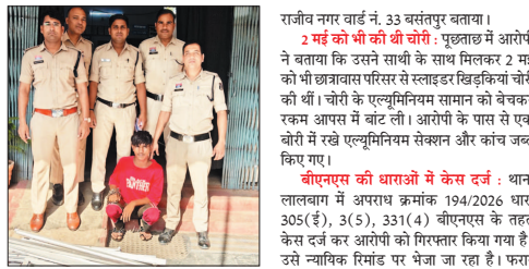
राजीव नगर वार्ड नं. 33 बसंतपुर बलाया। 2 मई को भी की चोरी : पुष्पाछ में आरोपी ने बताया कि उसने साथी के साथ मिलकर 2 मई को भी छात्रावास परिसर से स्टाइलड खिड़कियां चोरी की थीं। चोरी के एल्यूमिनियम सामान को बेचकर रकम आपस में बांट ली। आरोपी के पास से एक बॉय में रखे एल्यूमिनियम सेवान और कांच जब्त किए गए।

थाना लालबाग पुलिस ने पेंडिंग स्थित निर्माणधीन आईटीआई बालिका छात्रावास से सिल्वर धातु के स्टाइलड फ्रेम चोरी के मामले में एक आरोपी को गिरफ्तार किया है। आरोपी के कब्जे से 20 हजार रुपये कीमत का एल्यूमिनियम सेवान व खिड़की के कांच बरामद किए गए। दूसरा आरोपी फरार है, जिसकी तलाश जारी है।