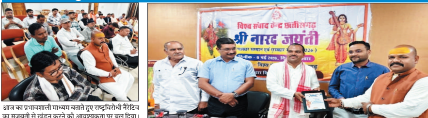
आज का प्रभावशाली माध्यम बताते हुए राष्ट्रविरोधी प्रॉपेगंडा का मजबूती से खंडन करने की आवश्यकता पर बल दिया।