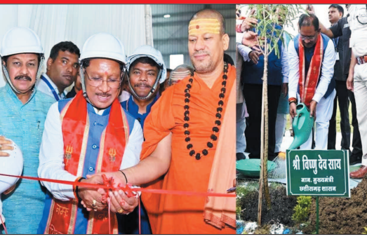
मुख्यमंत्री विष्णु देव साय और वन मंत्री केदार करण्य द्वारा लोकार्पित यह इकाई वनोपज आधारित अर्थव्यवस्था का पावरहाउस है। आंवला, बेल, गिलोय और अरवंगंधा जैसे उत्पादों को जून्, कैडी और हबल पाउडर में परिवर्तित किया जाता है। वैज्ञानिक भंडारण यहाँ 20 हजार मीट्रिक टन क्षमता वाले अत्याधुनिक

गोदाम हैं, जो उपज को सुरक्षित रखते हुए संग्रहकों को बाजार के उतार-चढ़ाव से बचाते हैं। छत्तीसगढ़ हबलैय स्थानीय से वैश्विक तक राज्य सरकार का यह आधिकारिक ब्रांड युद्धता और प्राज्ञातिक उत्पादों का पर्याय बन चुका है। राजीवजी स्टोरों की संख्या