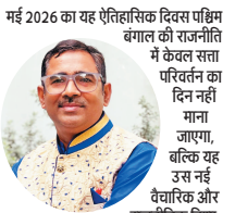
मई 2026 का यह ऐतिहासिक दिवस पश्चिम बंगाल की राजनीति में केवल सत्ता परिवर्तन का दिन नहीं माना जाएगा, बल्कि यह उस नई वैचारिक और राजनीतिक दिशा का प्रतीक बनेगा जिसमें 'सोনার बंगला', 'प्रभु प्रणम' और 'भयमुक्त समाज' का संकल्प एक साथ दिखाई देता है। इसी ऐतिहासिक दिन मुख्यमंत्री शुभेंद्रु अधिकारी ने पश्चिम बंगाल के प्रथम भाजपा मुख्यमंत्री के रूप में शपथ ग्रहण की।

यह संयोग भी अत्यंत महत्वपूर्ण माना गया कि यह शपथ ग्रहण उस दिन हुआ जिसे गुरुदेव रविदत्ता टैगोर की स्मृतियों और उनके राष्ट्रियंत्रित ने भी जोड़ा जाता है। गुरुदेव ने जिस सोनार बंगला की कल्पना की थी, वह केवल समृद्धि का नहीं बल्कि सांस्कृतिक गौरव, आत्मसम्मान, ज्ञान और मानवता से भरे समाज का स्वप्न था। आज बंगाल की नई सरकार उसी भावना को आधुनिक विकास, सुरक्षा और राष्ट्रीय चेतना के साथ जोड़ने का प्रयास करती दिखाई दे रही है।