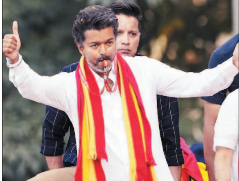
नई दृष्टिबिंदु / वैमर्ई

टीवीके को पहले ही चुनाव में 108 सीटें, कांग्रेस-वामदलों के समर्थन से बना बहुमत