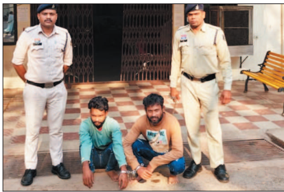
तत्काल कार्रवाई करते हुए पुलिस ने दोनों को अलग-अलग स्थानों से पकड़ा।