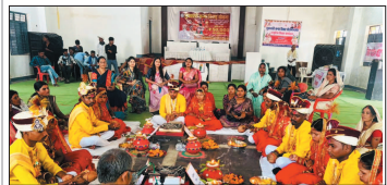
नई दृष्टिबिंदु / राजनांदगांव

मुख्यमंत्री कन्या विवाह योजना के तहत गुस्वार को जिले में आयोजित सामूहिक विवाह कार्यक्रम में 46 जोड़ों का विवाह संपन्न हुआ। इसमें 44 जोड़ों का विवाह हिन्दू रीति से और 2 जोड़ों का विवाह बौद्ध रीति से कराया गया। सतनाम भवन में 25 जोड़ों ने लिए फेरे