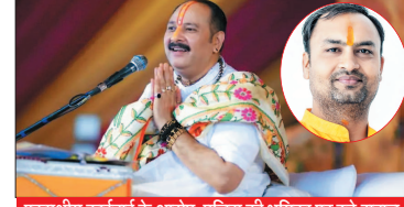
एकपक्षीय कार्रवाई के आरोप, पुलिस की भूमिका पर उठे सवाल