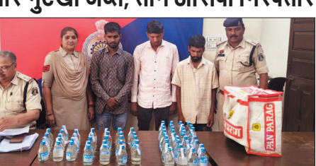
नई दृष्टिबिंदु / राजनांदगांव

बसंतपुर पुलिस ने अवैध शराब और 72 युक्त गुटखा के खिलाफ बड़ी कार्रवाई की है। पुलिस ने अलग-अलग जगहों से 72 पौवा देशी शराब, प्रक्रिया के साथ निर्विवाद चुनाव करायी। समिति ने सभी सहयोगियों का आभार जताया। चुनाव प्रक्रिया एक माह से चल रही थी।