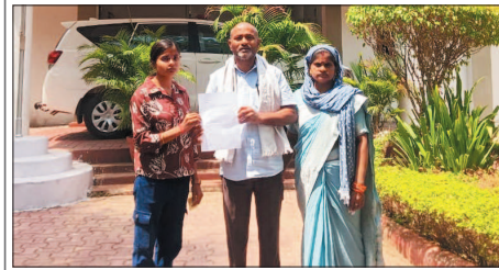
नई दृष्टि / जंमगीर-बांघा

35 जवान, हजारों सीसी टीवी, कॉल डिटेल जांच के बाद भी मुख्य आरोपी फरार ; पीड़ित परिवार आईजी दफ्तर तक पहुंचा