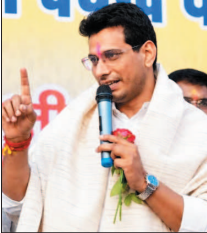
दलगत राजनीति से ऊपर उठकर हसदेव को बचाने की जरूरत है।