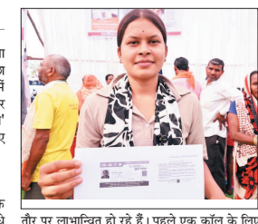
तौर पर लाभान्वित हो रहे हैं। पहले एक कॉल के लिए

ग्राम पंचायत मेडानार के आसित गांव ताहकाडोंड के साथ कंदेर और ब्रेहवेडा के करीब 400 ग्रामीण अब सीधे