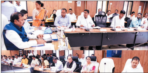
पौधारोपण को प्राथमिकता दी जाए। नगरीय हावर्टिंग सिस्टम को अनिवार्य किया जाए। उन्होंने निकायों में विलिंडिंग परमिशन देते समय रेन वॉटर