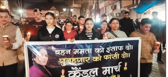
बहन ममता को न्याय दहो

एप्सिड अंकुश मानवता के मुंह पर वह तमाचा है, जहां सत्यता, संस्कृति और संवेदनएं एक साथ दम तोड़ती दिखाई देती हैं। ऐसे अपराध केवल किसी एक व्यक्ति पर