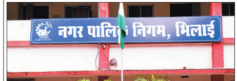
नई दृष्टि / भिलाई

नगर पालिका निगम भिलाई ने शासकीय स्कूलों में स्वच्छता सुधारों की दिशा में बड़ा कदम उठाया है। आयुक्त राजीव कुमार पांडेय ने सभी जून आयुक्तों को निर्देश दिए हैं कि शिक्षा उपकरण की राशि का उपयोग प्राथमिकता से स्कूलों के शौचालयों के जीर्णोद्धार, मरम्मत और निर्यात में किया जाए। आयुक्त ने सभी जून आयुक्तों को अपने क्षेत्रों के शासकीय स्कूलों का वार्षिक निरीक्षण कर शौचालयों की वतमोन स्थिति का आकलन करने को कहा है। उन्होंने स्पष्ट किया है कि निर्माण कार्यों में गुणवत्ता से कोई समझौता नहीं