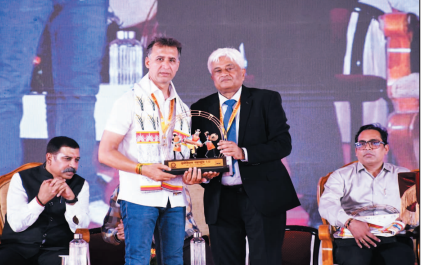
मैं हर संभव सहयोग करूंगा। उन्होंने कहा कि स्टार्टअप शुरू करने पर फाइनस और मार्केट दिलाने में चेम्बर महत्वपूर्ण भूमिका निभाएगा। मुख्यमंत्री व वित्तमंत्री रहे मौजूद कार्यक्रम में मुख्यमंत्री विष्णु देव साव और वित्त मंत्री ओपी चौधरी समेत कई गणमान्य अतिथि शामिल हुए। सभी ने युवाओं के प्रयासों की सराहना की और प्रदेश में नवाचार संस्कृति को बढ़ावा देने पर जोर दिया। वक्ताओं ने कहा कि इनोवेशन महाकुंभ 1.0 ने युवाओं को प्रतिभा दिखाने का सशक्त