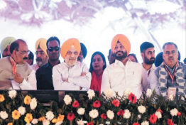
राजधानी क्षेत्र विकास प्राधिकरण की पहली बैठक में भाजपा के सदस्यों का समूह।

पंजाब को लेकर भाजपा इसलिए भी उत्साहित है क्योंकि उस यकन है कि फिर से एकजुट हो रहे इंडिया गठबंधन की एकता यहां नहीं रहेगी। इस राज्य में कांग्रेस तो अकेले लड़ेगी ही, आस आसानी पार्टी (आप) सत्ता में आसानी की आस से पूरी कोशिश करेगी। आप सुप्रभो अरविंद केजरीवाल कह चुके हैं कि भाजपा के नियंत्रण को पंजाब रहेगा। अकाली दल अपनी तैयारी कर ही रहा