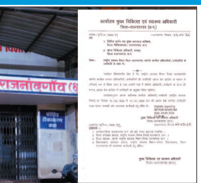
आदेश में यह भी स्पष्ट है कि अगले माह से इन कर्मचारियों का वेतन भुगतान केवल डिजिटल उपस्थिति के आधार पर ही किया जाएगा।

सीएमएचओ कार्यालय से हाल ही में जारी निर्देश में कहा गया है कि एनएचएम के अंगत कार्यरत कर्मचारियों के लिए आधार आधारित उपस्थिति अनिवार्य होगी।