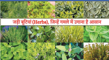
जड़ी बूटियाँ (Herbs), जिन्हें गमले में उगाना है आसान