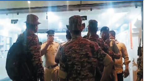
भारत का टीएमसी पर आरोप, जांच जारी

पश्चिम बंगाल के नॉर्थ 24 परगना जिले के मध्यग्राम इलाके में भाजपा नेता सुवेंदु अधिकारी के निजी सहायक की गोली मारकर हत्या कर दी गई। घटना बुधवार शाम की बताई जा रही है। हमलावरों ने पीए को 4 गोलीया मारी। मौके पर ही उनकी मौत हो गई। भाजपा ने हत्या का आरोप तृणमूल कांग्रेस कार्यकर्ताओं पर लगाया है।