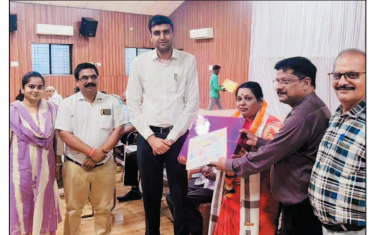
नई दृष्टिबिंदु / दुर्ग