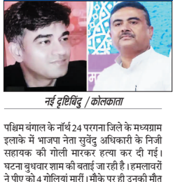
नई दृष्टिबिंदु / कोलकाता