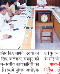
इमरजेंसी रूट विलियट किए जाएंगे। आयोजन के संचालन के लिए कलेक्टर रायपुर की अध्यक्षता में उच्च-स्तरीय कार्यकारिणी का गठन किया गया है। इसमें पुलिस अधीक्षक ग्रामीण, आयुक्त नगर निगम, संचालक खेल एवं युवा कल्याण, आरटीओ और एनआरडी के सौईओ शामिल हैं।

मुख्य सचिव ने कहा कि दशकों की सुरक्षा और सुगम यातायात प्रशासन की सर्वोच्च प्राथमिकता है। पार्किंग एरिया और स्टेडियम के चारों ओर सीसीटीवी कैमरों का सघन जाल बिछाया जाएगा। बैरिकेडिंग और पार्किंग की निगरानी पुलिस, एनआरडी और बीसीसीआई की संयुक्त टीम सहाएंगी। आपात सेवा के लिए डॉकटेंटेंट रूट : फायर ब्रिगेड और एम्बुलेंस के लिए डॉकटेंटेंट करने से होगा। ऑनलाइन बुकिंग के बाद रायपुर पहुंचने वाली हजारों दर्शकों की भीड़ को देखते हुए पुलिस कमिश्नर रायपुर को विशेष कार्ययोजना बनाने के निर्देश दिए गए हैं।