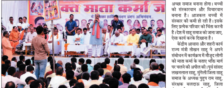
नई दृष्टिबिंदु / रायपुर