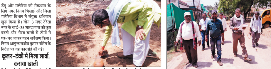
नई दृष्टिबिंदु / भिलाई