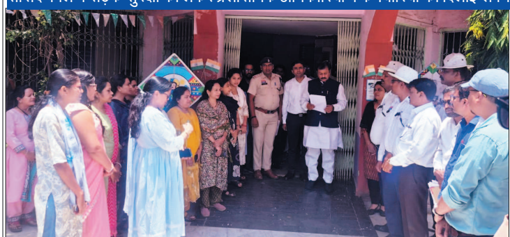
नई दृष्टिबिंदु / दुर्ग

सांसद बघेल ने सड़क सुरक्षा को लेकर प्रशासनिक अधिकारियों व कर्मचारियों को दिलाई शपथ