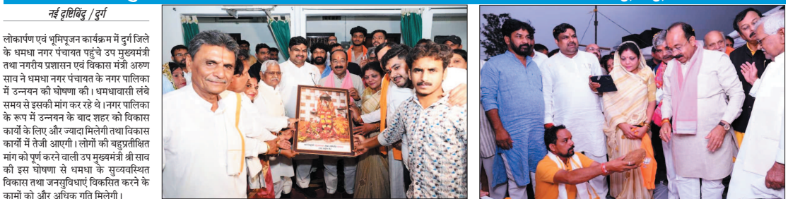
नई दृष्टिबिंदु / दुर्ग

उपमुख्यमंत्री ने धमधा में 7 करोड़ के कार्यों का किया लोकार्पण-भूमिपूजन