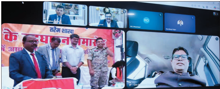
नई दृष्टिबिंदु / रायपुर

बौजपुर जिले के उसर विकासखंड अंतर्गत तर्रम ग्राम में आज बैंक ऑफ बड़ौदा की नई शाखा का वर्चुअल माध्यम से उद्घाटन किया गया। इस