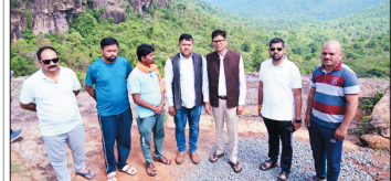
नई दृष्टिबिंदु / रायपुर

बस्तर जिले के विकासखंड लोहंडीगुड़ा अंतर्गत ग्राम पंचायत मटनार के आश्रित ग्राम मेदरी में निर्माणाधीन मटनार बैराज सह उद्देहनीय परियोजना का वित्त मंत्री ओपी चौधरी ने निरीक्षण किया। यह परियोजना इंद्रावती नदी पर लगभग 1,269 करोड़ रुपये की लागत से विकसित की जा रही है।