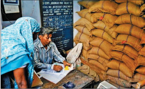
राशि की जानकारी उपलब्ध कराई जाएगी तथा उनकी समस्याओं का समाधान मौके पर किया जाएगा।

आवास योजनाओं, विशेषकर प्रधानमंत्री आवास योजना-ग्रामीण के अंतर्गत स्वीकृत सभी आवसों को अधिकतम 90 दिनों में पूर्ण करने के लिए ग्राम पंचायतों में विस्तृत कार्ययोजना पर चर्चा की जाएगी। साथ ही हितग्राहियों को अवक तथा