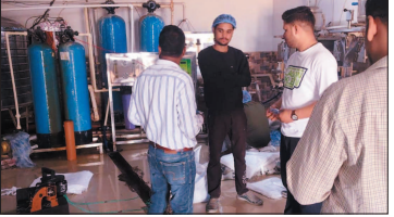
नई दृष्टिबिंदु / मुंगेली