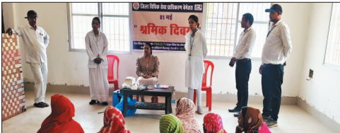
नई दृष्टिबिंदु / बेमेतरा