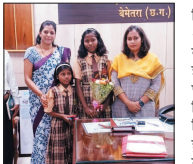
नई दृष्टिबिंदु / बेमेतरा

जिला मुख्यालय बेमेतरा के मोहभद्र वाई क्रमांक 6 में रहने वाले तीनों ऐसे भाई-बहन, जिनके माता-पिता का आकस्मिक निधन हो गया है, पूर्णतः बेसहारा हो गए थे। इन बच्चों को शासकालय योजनाओं का लाभ फलाने हेतु जनदर्शन में आवेदन प्रस्तुत किया गया था।