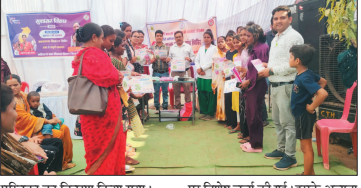
नई दृष्टिबिंदु / वेमरारा

जिले में युवाओं के अंतर्गत जनसंख्या निवारण शिविरों के दौरान बेटी बचाओ-बेटी आओ योजना के तहत निःशुल्क स्वास्थ्य जांच शिविर का आयोजन किया गया। यह शिविर पंचायत वेमरारा अंतर्गत ग्राम पंचायत वेमरारा अंतर्गत ग्राम पंचायत सख्या में आयोजित हुआ। जिला महिला सशक्तिकरण केंद्र (हब) द्वारा भारत सरकार की स्वास्थ्य संबंधी महत्वपूर्ण जानकारी दी गई। साथ ही एचपीवी वैकसीनेशन, बाल विवाह मुक्त छत्तीसगढ़ अभियान के बारे में भी विस्तार से जानकारी प्रदान की गई। कार्यक्रम में संचालित आहार, आयुष्मान युव खाद्य पदार्थों का सेवन, IFA टैबलेट के महत्व, पीएमजी की रक्षाधाम एवं मासिक धर्म स्वच्छता जैसे विषयों