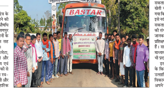
नई दृष्टिबिंदु / बस्तर

नक्सल प्रभावित बस्तर के अबुझमाड़ क्षेत्र के किसानों को आर्थिक रूप से सशक्त बनाने की दिशा में एक महत्वपूर्ण पहल की गई है। औषधी पाद बोर्ड रायपुर द्वारा 2 मई को नारायणपुर जिले के 50 से अधिक आदिवासी किसानों के लिए धमतरी जिले में अध्ययन प्रवास सह प्रशिक्षण कार्यक्रम आयोजित किया गया। इस कार्यक्रम के तहत कोहकमेटा, कुरुभरना, कंवाड़ी, किरहका, कोडोली और बांसिंग गांव के किसानों को औषधीय एवं सुगंधित पौधों की उन्नत खेती की तकनीकों से अवगत कराया गया। किसानों ने महिला स्व-सहायता समूहों द्वारा की जा रही खस, ब्राह्मी और चू की खेती का अवलोकन कर व्यावहारिक जानकारी हासिल की। यह कार्यक्रम नई सुबह की ओर अभियान के अंतर्गत आयोजित किया गया, जिसका उद्देश्य बस्तर के किसानों को आर्थिक रूप से सशक्त बनाना और उन्हें जंगलों में मांग वाली फसलों की ओर प्रेरित करना है। इस पहल के माध्यम से कौशल विकास और आय वृद्धि पर विशेष जोर