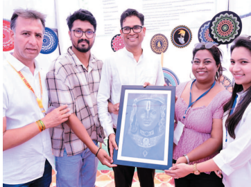
नई दृष्टिबिंदु / बस्तर

छत्तीसगढ़ के वित्त मंत्री ओपी चौधरी ने बस्तर स्थित शाही मण्डि कर्म कौशल विद्यालय में आयोजित इनोवेशन महाकुंभ 1.0 में पहुंचकर विभिन्न स्टॉल्स का निरीक्षण किया। इस दौरान उन्होंने प्रदेश के अलग-अलग क्षेत्रों तथा बस्तर के युवाओं द्वारा विकसित नवाचारों को करीब से देखा और उनके प्रयासों की सराहना की। वित्त मंत्री ओपी चौधरी ने युवाओं से संवाद करते हुए कहा कि यदि हम माँ सरस्वती के प्रदत्त कौशल बढे, तो माँ लक्ष्मी स्वयं हमारे साथ आ जाएगी। उन्होंने ज्ञान और कौशल को सफलता की कुंजी बताते हुए युवाओं को निरंतर सीखने और खुद को विकसित करने के लिए प्रेरित किया। उन्होंने कहा कि आज का दौर ज्ञान आधारित अर्थव्यवस्था का है, जिसमें नवाचार