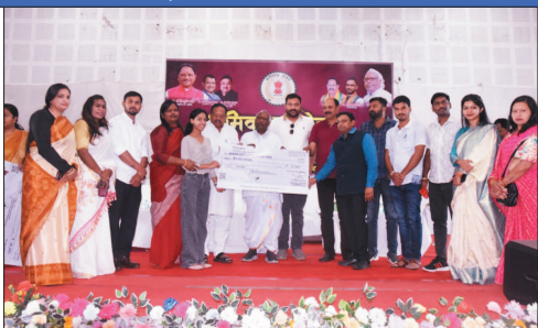
योजना का लाभ ले। नगर निगम अंबिकापुर महापौर श्रीमती मंजूबा

कार्यक्रम में विशिष्ट अतिथि लुण्डा विधायक प्रवीण मिश्र ने कहा कि हर व्यक्ति किसी न किसी रूप में श्रमिक है और परिश्रम ही परिवार के भरण-पोषण का आधार है। उन्होंने श्रमिक पंजीयन कर योजनाओं का लाभ लेने उपस्थित श्रमिक जनों को प्रोत्साहित किया। वहीं, छत्तीसगढ़ राज्य युवा आयोग के अध्यक्ष विश्व विजय सिंह तोहार ने विकासखंड से आए श्रमिकों से कहा कि शासन आपके हितों के लिए जनकल्याणकारी योजनाएं संचालित कर रही है जिससे हर वर्ग के व्यक्ति तक योजनाओं का लाभ मिले। आप सभी श्रम विभाग द्वारा संचालित योजनाओं की जानकारी लेकर