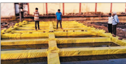
नई दृष्टिबिंदु / बेमेतरा

कृषि विभाग द्वारा मोहांगव प्रक्षेत्र में तैयार