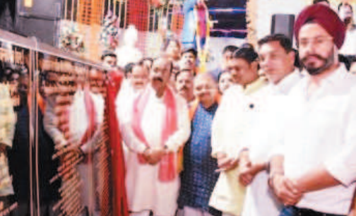
नई दृष्टिबिंदु / बेमेतरा

इस दौरान उप मुख्यमंत्री अरूण साव ने डोंगरगढ़ शहर को 5 करोड़ 20 लाख रूपय की सीमागत दी। उन्होंने 15वां वित्त आयोग मंड अंतर्गत 1 करोड़ 94 लाख 88 हजार रूपय के राउसकला क्षेत्र में इंटेकवेल, पंप हाऊस एवं पीपिंग निर्माण कार्य तथा 71 लाख 62 हजार रूपय की लागत से पतियाजोब क्षेत्र में संस्करण पीप निर्माण व वीटी मोटर स्थापना कार्य और स्वच्छ भारत मिशन-शहरी 2.0 अंतर्गत 1 करोड़ 8 लाख 21 हजार रूपय की लागत से सूखे एवं गीले कचरे के प्रबंधन हेतु संयंत्रों की स्थापना तथा स्थापित संयंत्रों के उन्नयन व विकास कार्य का भूमि पूजन किया। इसके साथ ही उन्होंने नगर पालिका परिषद डोंगरगढ़ के विभिन्न चार्डों में अधीसंचना मंड 2025-26 अंतर्गत 1 करोड़ 45 लाख 45 हजार रूपय की लागत से 36 कार्यों का भूमि पूजन किया। उप