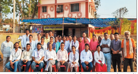
नई दृष्टिबिंदु / बलौदाबाजार