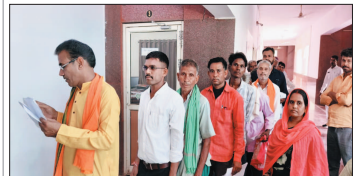
नई दृष्टिबिंदु / बेमेतरा

जिले में सुशासन तिहार-2026 के अंतर्गत आम नागरिकों की समस्याओं के त्वरित निराकरण और शासन की योजनाओं का लाभ सीधे आमजन तक पहुंचाने के उद्देश्य से दो प्रमुख स्थानों पर समाधान शिविर आयोजित किए जा रहे हैं। जनपद पंचायत बेमेतरा अंतर्गत ग्राम पंचायत मोहरंगा के शासकालय उच्चतर माध्यमिक विद्यालय परिसर में तथा नगर पंचायत बरेला के ग्राम सलधा स्थित कार्यालय भवन में यह शिविर आयोजित होगा। दोनों स्थानों पर शिविर का समय प्रायः 10 बजे से दोपहर 03 बजे तक निर्धारित किया गया है।