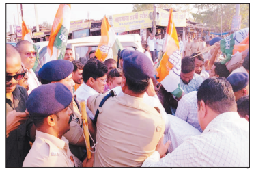
नई दृष्टिबिंदु / उरई