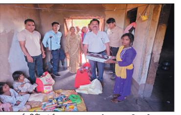
नई दृष्टिबिंदु / खैराबाद

विकासखंड छूँछखदान के सुदूर पंचायत संघ निजामडीह में प्रशासनिक प्रवेदनशैलीत और सामाजिक एकजुटता की एक अनुकूलणीय मिसाल सामने आई है। मां को खोने के बाद असहाय हुई सात मासूम बेटियों के जीवन में अब जिला प्रशासन और समाज ने मिलकर सहारा दिया है, जिससे उनके परिचर को लेकर नई उम्मीद जगी है।