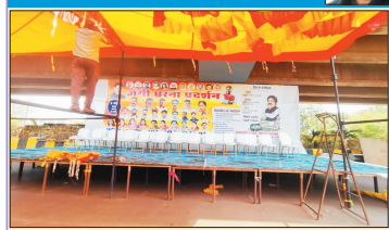
नगर निगम भिलाई के समाने सुबह 11.30 तक भाजपाई पंडाल सज रहे थे