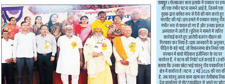
नई दृष्टिबिंदु / भिलाई