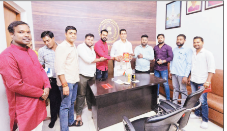
सहित अन्य क्षेत्रों से आए युवाओं ने रोजगार और शिक्षा से जुड़े विषयों पर विधायक से चर्चा की। जिस पर विधायक ने स्थानीय स्तर पर

भिलाई नगर विधायक देवेन्द्र यादव ने सेक्टर 5 स्थित कार्यालय में जनता से भेंट मुलाकात कर उनकी समस्याएं सुनी। पानी और सफाई से संबंधित विषयों पर निगम और बीएसपी के अधिकारियों से चर्चा कर त्वरित निराकरण के लिए निर्देशित किया।