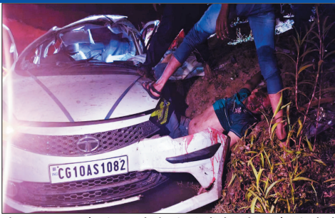
की वजह माना जा रहा है। पुलिस मामले की विस्तृत जांच कर रही है। घटना के बाद बिरगांव में शोक की लहर है। परिजनों की सूचना दे दी गई है।

पांदातराई थाना क्षेत्र के गंडई रोड स्थित फोक नदी में रविवार देर रात तेज रफ्तार कार के अनियंत्रित होकर गिरने से चार युवकों की मौत हुई। हादसे में दो युवक गंभीर रूप से घायल हैं। सभी युवक बिरगांव के रहने वाले थे और पंडरिया में शादी समारोह में शामिल होने जा रहे थे।