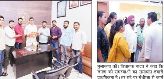
अवसर बढ़ाने की दिशा में योजनाबद्ध कार्य करने का आश्वासन दिया। सरनामी, साह समा और बौद्ध समाज के पदाधिकारियों ने सीजन