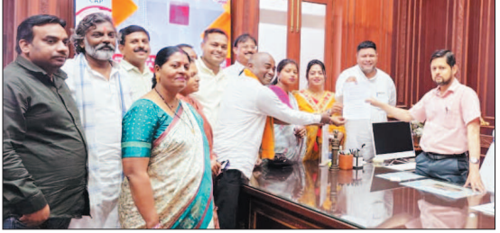
नई दृष्टिबिंदु / दुर्ग-भिलाई