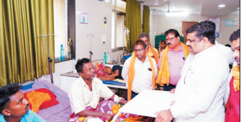
नई दृष्टिबिंदु / दुर्ग

रविवार देर रात बारात से वापस लौटते समय हुई बस दुर्घटना में घायल हुए के तिरुईह क्षेत्र के नारिकेल से मिलने प्रदेश के केविट मंत्री गजेन्द्र यादव आज जिला अस्पताल पहुंचे। उन्होंने अस्पताल में भर्ती सभी घायलों से मुलाकात कर उनका हालचाल जाना तथा चिकित्सकों से उपचार की जानकारी ली। मंत्री श्री यादव ने घायलों को हर संभव बेहतर इलाज उपलब्ध कराने भरसा देते हुए उनके शीघ्र स्वस्थ होने की कामना किए।