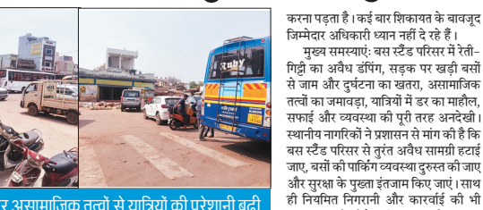
सड़क पर खड़ी बसें और असामाजिक तत्वों से यात्रियों की परेशानी बढ़ी

स्टैंड के अंदर असामाजिक तत्वों का जमावड़ा भी बढ़ी समस्या का खतरा जा रहा है। शाम होते ही यहाँ संदिग्ध गतिविधियों बढ़ जाती हैं, जिससे सरकार महिला यात्रियों को असुरक्षा का सामना