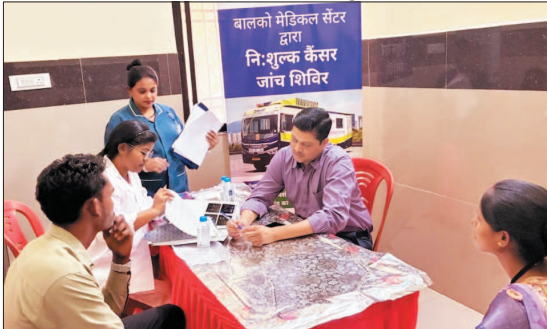
मुखा कैंसर की जांच (ब्रश साइटोलॉजी) तथा गर्भाशय ग्रीवा कैंसर की जांच (पैप स्मीयर) जैसी सुविधाएं मरीजों को उपलब्ध कराई गईं। जांच के दौरान 5 मरीज संभावित रूप से पांजिटिव पाए गए।

शिविर में जिले के अलग अलग विकासखंडों से पहुंचे मरीजों ने अपनी जांच करवाई। इस दौरान कुल 25 मरीजों की जांच की गई, जिसमें 13 पुरुष एवं 12 महिलाएं शामिल थीं। जिसमें मेमोग्राफी मशीन के माध्यम से स्तन जांच,