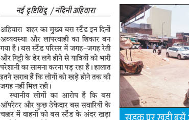
सड़क पर खड़ी बसें और असामाजिक तत्वों से यात्रियों की परेशानी बढ़ी

एक नगर निगम में सुशासन की छाया गजब छाई है। हुआ ये है कि इस निगम के आयुक्त जी को पक्ष विपक्ष में मिल कर हटाने का एकमन प्रस्ताव पारित किया और शासन को भेज दिया। अब 25 मार्च के इतर प्रस्ताव पर सुशासन सरकार ने कोई फेसला ही नहीं लिया है। निगम में भी सुशासन वाली पाटी की ही सरकार है। अपनी ही पाटी के सत्ता शासन के रवेये से निगम के नेताजी लोग बिक्डे हुए हैं। अभी इसी आत्मन में निगम आयुक्त की चिह्नी ने फिर टटा बदा दिया है। आयुक्त साहब ने एक नोटश्रीट बढाई कि मेरा दन कोसिल की बैठक आहुत करनी है, ताकि सामान्य रूप में आए बिषयो और एमआरसी के प्रस्तावों पर चर्चा और निगम हो। अब सीएच निगम के नेताजी लोगो का दिल क्यों नहीं दुखेगा। जिस समय सभा में फेसला लिया गया कि आयुक्त को हटया जाए और प्रस्ताव सरकार को भेजा गया। वही आयुक्त साहब नोटश्रीट चला रहे है कि भैया लोग मीटिंग करना है मेरु दन कोसिल की, ताकि ललित विषयो पर चर्चा हो और कार्य हो। सभा को गोआई मोड में नोटश्रीट पर ही मेरु साहब ने लिख दिया है - आयुक्त को सामान्य सभा में अपने अधिकारो का प्रयोग कर उन्हे उनके दूद से हटा दिया है। इतके बाद आयुक्त के इस्तफा से किसी भी प्रकार की बैठक या कार्या को संपानन नहीं किया जा सकता है अब इस नोटश्रीट युद्ध के बाद मेरु दन कोसिल की बैठक का मामला पेंडिंग चला गया है वैसे ही जैसे सुशासन सरकार के पास कमिश्नर को हटाने का प्रस्ताव पेंडिंग चला गया है। इस निगम में दहलते हुए राजश्री का पाउच फाउंड मुंह में डाल कर बाँकेनाल ने सहाजी से कहा है कि, नोटश्रीट की बात अमर सही है तो वेक जो साहब के दस्ताखत से हालिया दिनों तक जारी हुआ है उन्का क्या होगा।