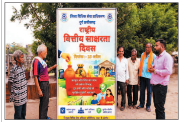
नई दृष्टिबिंदु / दुर्ग

राष्ट्रीय वित्तीय साक्षरता दिवस के अवसर पर जिला विधिक सेवा प्राधिकरण दुर्ग द्वारा एक व्यापक एवं प्रभावी वित्तीय साक्षरता जागरूकता शिबिर का आयोजन किया गया। इस अवसर पर प्रधान जिला एवं सत्र न्यायाधीश/अध्यक्ष, जिला विधिक सेवा प्राधिकरण, दुर्ग के मार्गदर्शन में दुर्ग, भिलाई-3 एवं मध्या क्षेत्र के पैरालाइज्ड वॉलंटियर्स ने उत्साहपूर्वक सहभागिता निभाई और समाज के विभिन्न वर्गों तक पहुंचकर वित्तीय साक्षरता एवं कानूनी अधिकारों के प्रति जागरूकता फैलाने का महत्वपूर्ण कार्य किया।