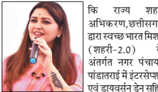
एसटीपी निर्माण के लिए 73 करोड़ 36 लाख 88 हजार की स्वीकृति क्षेत्र के समग्र विकास को दिशा में एक महत्वपूर्ण कदम है। यह परियोजना नगर की नालियों के गंदे पानी का प्रबंधन सुनिश्चित करते हुए न केवल स्वच्छता व्यवस्था को सुदृढ़ करेगी, बल्कि पर्यावरण संरक्षण और जनस्वास्थ्य को भी मजबूती प्रदान करेगी। इसके माध्यम से शहर में गंदगी और जलमय का समस्या में कमी आएगी, प्राकृतिक जलस्रोत एवं अन्य जलस्रोतों को प्रदूषण से राहत मिलेगी और नगर स्वच्छता नगरवासियों का बेहतर स्वास्थ्य सुनिश्चित होगा। उन्होंने कहा कि आज डबल इंजन भाजपा सरकार में पंडरिया विधानसभा में विकास के नए आयाम लगावार स्थापित हो रहे हैं। नगर पालिका पंडरिया एवं नगर पंचायत इंदौर और पांडातराई में अर्थोसंरचना मद तथा राज्य प्रवर्तित योजना के अंतर्गत 73 करोड़ 36 लाख 79 हजार की स्वीकृति से नगरवासियों को बेहतर सुविधाएं मिलेंगी, वहीं अर्थोसंरचना मद के अंतर्गत इंदौर में दुकानों का निर्माण, मांगलिक भवन और मुक्तिधाम उन्नयन जैसे कार्य स्थानीय रोजगार, सामाजिक आयोजनों और मजबूत सुविधाओं को नई मजबूती देगा। यह विकास कार्य डबल इंजन भाजपा सरकार द्वारा नगरीय निकाय क्षेत्रों के समग्र विकास के प्रति प्रतिबद्धता को दर्शाती है।

उन्होंने आगे कहा कि हर नगर और हर नागरिक की मूलभूत सुविधाओं का विस्तार व क्षेत्र का विकास ही हमारा लक्ष्य है। नगरीय मुख्यमंत्री विष्णु देव सागर जी के नेतृत्व में भाजपा सरकार पंचायतों को सशक्त बनाने की दिशा में भी निरंतर प्रकृतिक जल स्रोतों का संरक्षण हो।