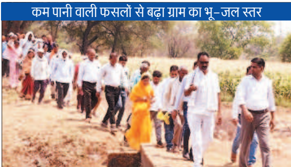
मॉडल को अपनाने के लिए प्रेरित करने कहा। ग्रामीणों ने बताया कि इस बदलाव से पानी की बचत हो रही है और फसल उत्पादन भी बेहतर हो रहा है। उन्होंने जानकारी दी कि पूर्व में गर्मों के मौसम में भू-जल स्तर नीचे