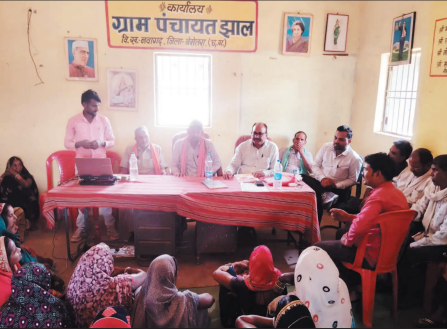
प्राथमिकता देते हुए पानी की हर बूंद को सहेजने का संदेश दिया गया। इसके साथ ही आगामी वर्षा ऋतु को ध्यान में रखते हुए पूर्व तैयारी, जल संरचना को संरक्षण एवं समयबद्ध कार्य निष्पादन पर भी गंभीरता से विचार-विमर्श किया गया।

ग्राम सभाओं में गांवों को आत्मनिर्भर एवं विकास बनाने के उद्देश्य से विभिन्न विकास योजनाओं की रूपरेखा तैयार की गई। इस दौरान महिला स्व-सहायता समूहों की सक्रिय भागीदारी देखने को मिली। उन्होंने नया तरिया, कमाई के जरिया अभियान के अंतर्गत आजीविका सर्वधन एवं स्वरोजगार के अवसरों पर विशेष रूप से अपने सुझाव प्रस्तुत किए। बैठकों में जल संरक्षण को सर्वोच्च