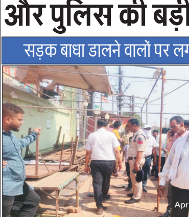
सड़क बाधा डालने वालों पर लताया जुर्माना