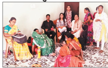
नई दृष्टिविदु / बेमेतरा

समूह से 271 लोगों का अत्याधुनिक हैंड हेल्ड पोटेबल एक्स-रे मशीन से निःशुल्क एक्स-रे किया गया, तथा 33 लोगों का जो संदेहास्पद था उनका स्पूटम अत्याधुनिक टू ड्रा नट मशीन से जांच हेतु संपन्न कलेक्शन करवाया गया। इस टीबी मुक्त भारत अभियान शिविर में साजा विकासखंड के स्वास्थ्य विभाग से सभी स्टॉफ, मिताभिन, द्वारा पूर्व से ही लोगों को टीबी मुक्त भारत जिला के अभियान की संपूर्ण जानकारी घर-घर सर्वे कर दी गई एवं जनजागरूकता अभियान भी चलाया गया।