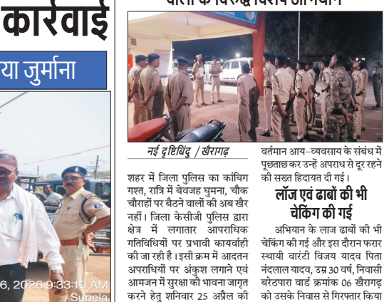
सड़क बाधा डालने वालों पर लताया जुर्माना