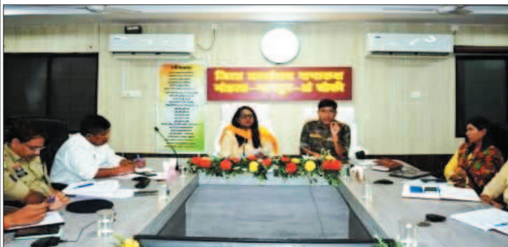
नई दृष्टिविदु / मोहला