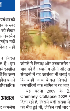
जांगे में निष्पक्ष और उच्चस्तरीय जांच की मांग की है। स्थायीय लोगों और सामाजिक संगठनों में यह आशंका भी जाई जा रही है कि कहीं जांच केवल निचले स्तर के कमचरियों तक सीमित न रह जाए। यह घटना 2009 के BALCO Chimney Collapse 2009 की याद दिला रही है, जिसमें बड़ी संख्या में मजदूरों की मौत हुई थी, लेकिन वर्षों बाद भी न्याय

मानवाधिकार आयोग सख्त रिपोर्ट तलाब मामले की गंभीरता को देखते हुए राष्ट्रीय मानवाधिकार आयोग ने स्वतः सज्ञान लेते हुए राय सरकार के विस्तृत रिपोर्ट मांगी है। आयोग ने स्पष्ट किया है कि दौषियों पर कार्रवाई, पीड़ितों को मुआजजा और जिम्मेदारी तय करने की प्रक्रिया पर पूरी पारदर्शिता जरूरी है। अधूरा रह गया। इसी कारण अब लोगों में यह डर गहरा गया है कि कहीं यह मामला भी समय के साथ ठंडे बस्ते में न चला जाए। सरकार के निर्देश, लेकिन सवाल कायम मुद्दामेंत्री विन्ध्य देव साय ने मुआजजा की घोषणा और जांच के निर्देश जारी हैं, लेकिन नक्सल बड़ा सवाल अब भी यही है—क्या जांच पूरी तरह निष्पक्ष रहे पापागी या प्रभावशाली लोगों का दबाव इसकी