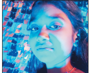
नई दृष्टिबिंदु / अठिकामपुर

सरगुजा जिले की घुनघुडा नदी में शनिवार शाम एक दिल दहला देने वाला हादसा हुआ। 12 वर्षीय बालिका और उसे बचाने के लिए नदी में कूदे उसके मामा-दोनों की डूबने से मौत हो गई। इस घटना ने पूरे इलाके को शोक में डुबो दिया है।