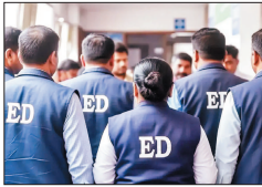
जो भारत में FORA के तहत पंजीकृत नहीं है, बावजूद इसके बड़े पैमाने पर फंडिंग और खर्च के संकेत मिले हैं।

प्रवर्तन निदेशालय (ED) ने एक बड़े वित्तीय नेटवर्क का खुलासा करते हुए बताया है कि विदेशी बैंक डेबिट कार्ड के जरिए भारत में करोड़ों रुपये की संचयन एंट्री कराई जा रही थी। 18 और 19 अप्रैल 2026 को देश के कई राज्यों में छह स्थानों पर एक साथ तलाशी अभियान चलाकर इस पूरे नेटवर्क का भंडाफोड़ किया गया।