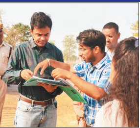
वितरण की जानकारी ली गई। ग्राम पंचायत सावनी में अमृत सरोवर निर्माण एवं वृक्षारोपण कार्यो के बेहतर रखरखाव हेतु निर्देश दिए गए।

ग्राम पंचायत अमेरी में तालाब पार स्थित वृक्षारोपण कार्य एवं हडअट निर्माण कार्य का निरीक्षण कर कार्यो की गुणवत्ता सुनिश्चित करने के निर्देश दिए गए। साथ ही अरुण डिजिटल सेवा केन्द्र का निरीक्षण कर पंचायत स्तर पर कर (टैक्स) संबंधी जानकारी ली गई तथा उसे पोर्टल में सम्वत पर दर्ज करने के निर्देश दिए गए। पेशन से संबंधित प्रकरणों की भी समीक्षा की गई एवं स्वच्छताग्राही दीदीयों को मानदेय