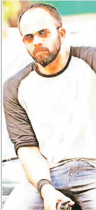
रोहित रोहड़ी केस: