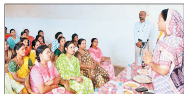
नई दृष्टिबिंदु / रायपुर