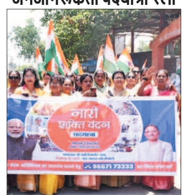
नई दृष्टिबिंदु / राजनांदगांव

जिले के डोंगरगढ़ विकासखंड मुख्यालय में आज नारी शक्ति वंदन अधिनियम के समर्थन में भव्य जनजागरूकता पदयात्रा आयोजन किया गया। इस अवसर पर बड़ी संख्या में महिलाओं, जनप्रतिनिधियों एवं सामाजिक कार्यकर्ताओं ने उस्ताहटवृंदक सहभागिता कर महिलाओं के सार्वजनिक हितों के प्रति आवाज उठाई।