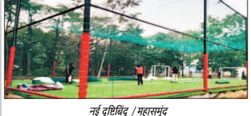
नई दृष्टिबिंदु / महासमुद्र

महासमुद्र जिले के ब्लॉक महासमुद्र अंतर्गत फारेस्ट ग्राउंड में तैयार किया गया बॉक्स क्रिकेट ग्राउंड विशेष सुविधा प्रदान करते हुए युवाओं और बच्चों को खेल के लिए प्रोत्साहित कर रहे हैं। अगस्त 2025 में पूर्ण होकर यह मैदान आम नागरिकों और खिलाड़ियों के लिए खोल दिया गया है।