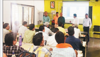
नई दृष्टिबिंदु / राजनांदगांव

जिले में जनगणना 2027 के अंतर्गत आरंभ से पद्मलाल पुनालाल बख्शी स्कूल राजनांदगांव में तीन दिवसीय प्रशिक्षण कार्यक्रम प्रारंभ किया गया। प्रशिक्षण में जनगणना कार्य से जुड़े अधिकारियों एवं कमचरियों को आवश्यक दिशा-निर्देश प्रदान किए जा रहे हैं। प्रशिक्षण के दौरान प्रतिभागियों को मकान सूचीकरण एवं आवास गणना की प्रक्रिया, प्रश्नों के सही संशोधन, ऑनलाइन मकान सूचीकरण एवं आवास गणना की जानकारी दी जा रही है। साथ ही निर्धारित समय-सीमा में गुणवत्तापूर्ण कार्य सुनिश्चित करने के निर्देश भी दिए गए। भारत सरकार द्वारा आयोजित जनगणना 2027 की तैयारियों जिले में तेजी से जारी हैं। जनगणना दो चरणों में आयोजित की जाएगी। जिसमें प्रथम चरण के अंतर्गत मकान सूचीकरण एवं आवास गणना का कार्य 1 मई 2026 से प्रारंभ किया जाएगा। अधिकारियों ने बताया कि जनगणना एक महत्वपूर्ण राष्ट्रीय कार्य है, जिसके माध्यम से प्राप्त आंकड़े शासन की योजनाओं के निर्माण एवं प्रभावी क्रियान्वयन में सहायक होते हैं। इसी संबंधित कमचरियों को पूर्ण जिम्मेदार एवं गंभीरता के साथ अपने दायित्वों का निर्वहन करने के निर्देश दिए गए।