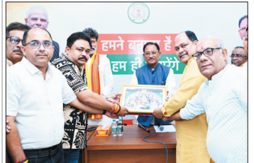
नई दृष्टिविंदू / रायपुर

मुख्यमंत्री विष्णु देव साय मुख्यमंत्री निवास में आयोजित बंगाली समाज के नववर्ष मिलन समारोह में शामिल हुए। इस अवसर पर उन्होंने समाज के सभी लोगों को बंगाली नववर्ष की हार्दिक बधाई एवं शुभकामनाएं दीं। उन्होंने कहा कि प्रदेश के विकास में बंगाली समाज का सदैव महत्वपूर्ण योगदान रहा है। विशेष रूप से मत्स्य पालन एवं उन्नत कृषि के क्षेत्र में छत्तीसगढ़ को नई ऊंचाई तक पहुंचाने में बंगाली समाज की बड़ी भूमिका रही है। साथ ही, स्वास्थ्य सेवाओं में भी समाज के लोग उल्लेखनीय योगदान दे रहे हैं।