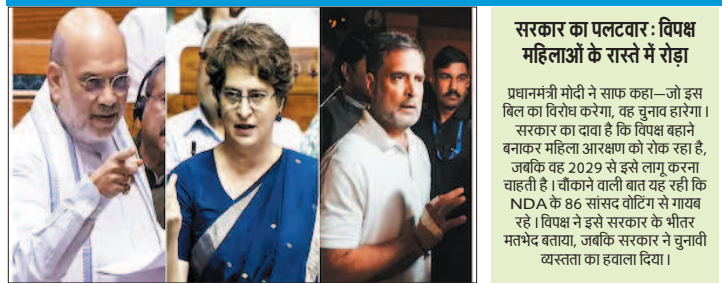
नई दृष्टिबिंदु / नईदिल्ली

विपक्ष ने मोका गंवाया, महिलाएं देख रही हैं राह का रोड़ा कौन : अमित शाह