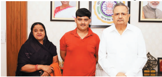
नई दृष्टिबिंदु / रायपुर-भिलाई