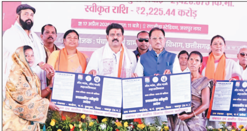
तहत प्रदेशभर में 10,000 आजीविका डबरी निर्माण का लक्ष्य निर्धारित किया गया था, जिसके विरुद्ध

महामाता गांधी राष्ट्रीय ग्रामीण रोजगार गारंटी योजना (मनरेगा) के अंतर्गत इस महाअभियान के