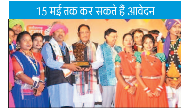
नई दृष्टिविंदू / रायपुर

उल्लेखनीय है कि जशपुर में रणजीता स्टेडियम के पीछे भागलपुर रोड स्थित एक सभाग 8-केयर यूनिट के रूप में विकसित किया गया है, जिसका पट्टा उद्घाटन मुख्यमंत्री ने किया था। यहां योग, प्राणायाम, मनोरंजन, सांस्कृतिक एवं सामुदायिक गतिविधियां,