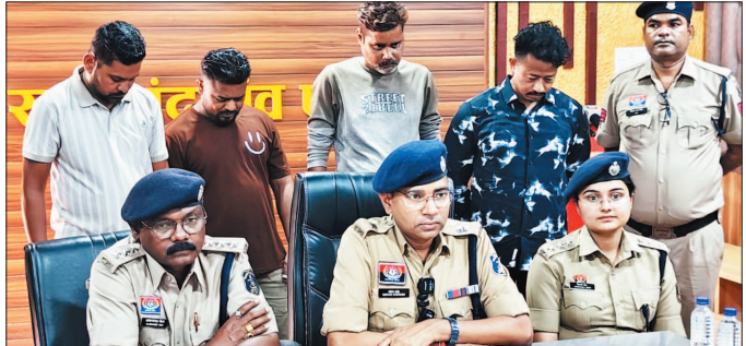
फामर्हाउस बना सट्टे का अड्डा