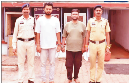
कर दो संदिग्धों को पकड़ लिया। तलाशी के दौरान आरोपियों के पास से लगभग 2 किलो

पुलिस को मुखबिंद से सूचना मिली थी कि पोरसी रोड स्थित बीज विकास निगम के पास, रुआबांधा भिलाई क्षेत्र में कुछ लोग अवैध मादक पदार्थ की विक्री कर रहे हैं। सूचना मिलने के बाद पुलिस टीम ने घेराबंदी