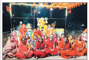
नई दृष्टिबिंदु / रिवासी-भिलाई