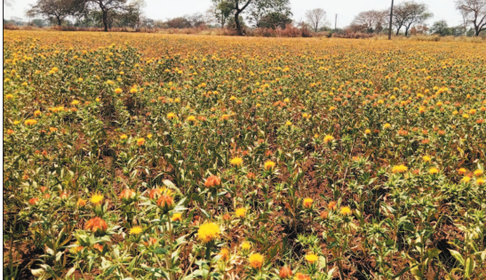
नई दृष्टि बिंदु / बालोद

सरकार की तिलहन प्रोत्साहन योजनाओं और जिला प्रशासन के नीर चेतना प्रदान का सकारात्मक असर अब बालोद के खेतों में दिखने लगा है। कृषि विभाग के कृषक चौपाल और फसल चक्र परिवर्तन के प्रोत्साहकता अभियान से प्रेरित होकर जिले के किसानों ने पारंपरिक खेती के साथ-साथ तिलहन उत्पादन, विशेषकर कुसुम की खेती को और कदम बढ़ाए हैं। कृषि विभाग के अधिकारियों ने बताया कि विभाग के तकनीकी मार्गदर्शन और प्रशिक्षण का परिणाम है कि बालोद जिले में जिस कुसुम की खेती का रुक्ना पहले था, वह इस वर्ष बढ़कर 157 हेक्टर तक