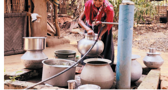
जनसंख्या 465 है, और अब हर परिवार को नियमित रूप से स्वच्छ पेयजल उपलब्ध हो रहा है।