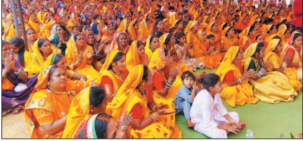
नई दृष्टिबिंदु / खैरागढ़

खैरागढ़-छुईखदान के विचारपुर-पंडरिया भाटा में युवावृत्त का दिन उद्घाटन के पन्नों में दर्ज हो गया, जब आस्था, एकता और संघर्ष का अद्भुत संगम देखने को मिला। किसान हनुमान संकट मोचन दक्षिणमुखी मंदिर की भव्य प्राण प्रतिष्ठा ने न केवल धार्मिक वातावरण को दिव्यता से भर दिया, बल्कि 55 गांवों के किसानों की सामूहिक शक्ति और संकल्प को भी नई पहचान दी।