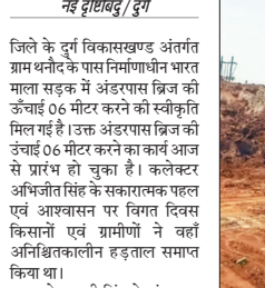
नई दृष्टिविंदु / दुर्ग