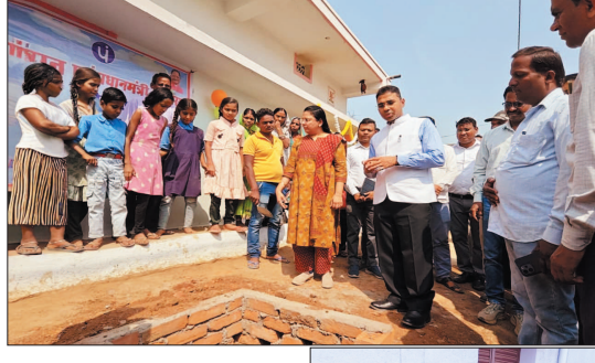
नई दृष्टिविदु / बलीदाबाजार

पखवाड़ेभर में 31 हजार से अधिक रेन वाटर हार्वेस्टिंग संरचनाओं का निर्माण, जनजागरूकता, सामुदायिक सहभागिता व श्रमदान बना मिसाल