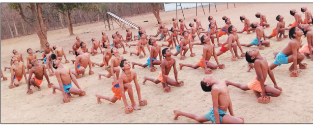
आय समाज सेक्टर-6, मिलाई

जांघों को मजबूती मिलती है, हृदय मजबूत एवं निरोगी रहती है तथा शरीर में नई ऊर्जा का संचार होता है। यह व्यायाम वजन को नियंत्रित रखने में सहायक है और शरीर को सुंदर व संतुलित बनाता है। साथ ही सीना चौड़ा होता है, भुजाएं मजबूत होती हैं और शरीर का संतुलन बेहतर होता है। शरीर की आवश्यकता के अनुसार वजन का संतुलित विकास