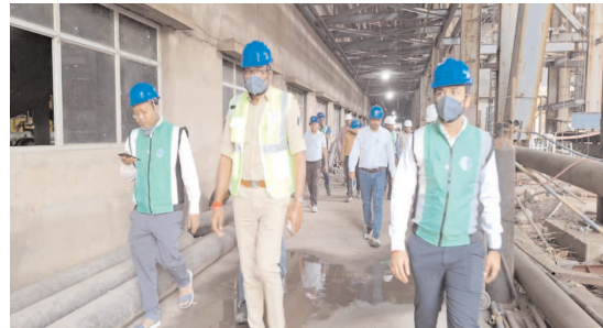
विशेष संवाददाता संदीप सिंह / सक्ती

छत्तीसगढ़ के सक्ती जिले के सिंघौतराई स्थित वेदांता लिमिटेड के पावर प्लांट में हुआ बॉयलर विस्फोट अब एक औद्योगिक हादसा नहीं, बल्कि सिस्टम पर बड़ा सवाल बनकर खड़ा हो गया है। मंगलवार दोपहर करीब 2:30 बजे हुए इस भीषण धमाके में अब तक 20 मजदूरों की मौत हो चुकी है, जबकि 40 से अधिक मजदूर बुरी तरह झुलसे हैं। कई की हालत 80 प्रतिशत तक जलने के कारण बेहद गंभीर बनी हुई है।