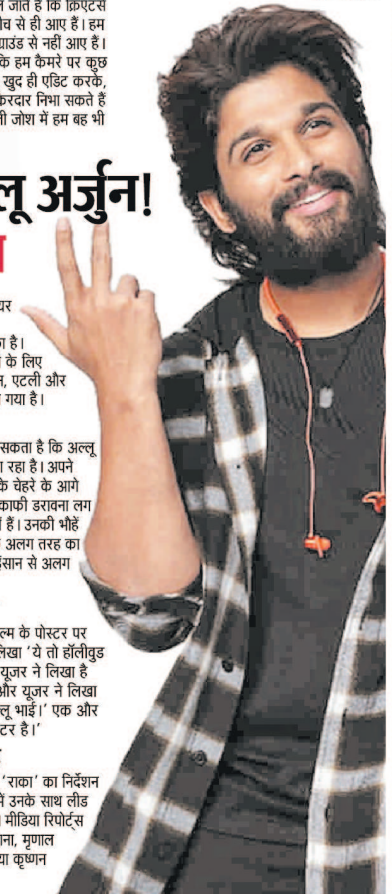
अल्लू अर्जुन की अगली फिल्म 'राका' का निर्देशन एटली कर रहे हैं। इस फिल्म में उनके साथ लीड रोल में दीपिका पादुकोण होंगी। मीडिया रिपोर्ट्स के मुताबिक इसमें रश्मिका मंन्ना, मृगाल ठाकुर, जानव्ही कपूर और राम्या कृष्णन नजर आ सकती हैं।

साउथ के बेहतरीन एक्टर अल्लू अर्जुन ने अपने जन्मदिन पर अपने फैंस को तोहफा दिया है। मेकर्स के साथ मिलकर उन्होंने अपनी अपकमिंग फिल्म का नाम और पोस्टर रिलीज किया है। पहले उनकी इस फिल्म को AA22x6 के नाम से जाना जाता था। फिस को फिल्म का नया नाम और पोस्टर काफी परसंद आ रहा है। इस पर उन्होंने रिप्लेशन दिए हैं।