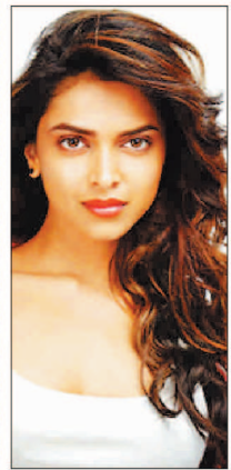
को AA22x6 का नाम से जाना जाता था। फिस को फिल्म का नया नाम और पोस्टर काफी परसंद आ रहा है। इस पर उन्होंने रिप्लेशन दिए हैं।

साउथ के बेहतरीन एक्टर अल्लू अर्जुन ने अपने जन्मदिन पर अपने फैंस को तोहफा दिया है। मेकर्स के साथ मिलकर उन्होंने अपनी अपकमिंग फिल्म का नाम और पोस्टर रिलीज किया है। पहले उनकी इस फिल्म को AA22x6 के नाम से जाना जाता था। फिस को फिल्म का नया नाम और पोस्टर काफी परसंद आ रहा है। इस पर उन्होंने रिप्लेशन दिए हैं।