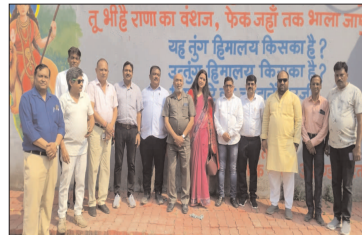
नई दृष्टिबिंदु / दुर्ग