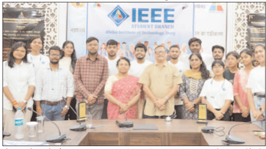
लेकर आयोजन को और व्यापक स्वरूप दिया। यह मंच प्रतिभागियों के लिए न केवल प्रतियोगिता, बल्कि वैश्विक स्तर तक पहुंचने का अवसर भी बना, जहां से चयनित टीमों में इंडोनेशिया में होने वाले फाइनल में में देश का प्रतिनिधित्व करेंगे। कार्यक्रम का शुभारंभ प्रचार्य

प्रदेश के तकनीकी शिक्षा परिदृश्य में एक महत्वपूर्ण उपलब्धि के रूप में, मिलाई इंस्टीट्यूट ऑफ टेक्नोलॉजी (बीआईटी), दुर्ग ने 9 और 10 अप्रैल को आईईईईई यूससिस्ट 12 2026 के प्रीलिमिनरी राउंड की सफल मेजबानी कर वैश्विक स्तर पर अपनी मजबूत उपस्थिति दर्ज कराई है। छत्तीसगढ़ से एकमात्र ग्लोबल पायलट सेंटर के रूप में चयनित बीआईटी दुर्ग इस प्रतिष्ठित अंतरराष्ट्रीय नवाचार मंच के लिए विश्व के चुनिंदा संस्थानों में शामिल रहा। दो दिनों तक चले इस आयोजन में युवाओं के नवाचार, उत्साह और तकनीकी सोच का जीवंत विश्लेषण के लिए 140 से अधिक टीमों के 120 से ज्यादा प्रतिभागियों ने समाज की वास्तविक समस्याओं के समाधान प्रस्तुत किए। नागपुर और कोयंबटूर से जुड़े प्रतिभागियों ने हाइड्रिड मोड में भाग