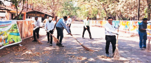
नई दृष्टिबिंदु / भिलाई

सेल-भिलाई इस्पात संयंत्र के स्टील मॉल्टिंग शॉप-2 विभाग में 16 से 31 मार्च 2026 तक मनाए जा रहे स्वच्छता पखवाड़ा के अंतर्गत 28 मार्च 2026 को एक व्यापक स्वच्छता अभियान एवं जन-जागरूकता कार्यक्रम का आयोजन किया गया। इस कार्यक्रम का उद्देश्य कारगर स्वच्छता एवं सुरक्षित कार्य वातावरण को बढ़ावा देना तथा कमचारियों में स्वच्छता के प्रति सतत जागरूकता प्रदान करना था। इस अवसर पर विभागीय परिसर में स्वच्छता के प्रति जागरूकता बढ़ाने एवं सामूहिक सहभागिता को प्रोत्साहित करने हेतु विभिन्न