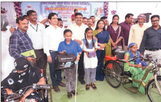
नई दृष्टिबिंदु / दुर्ग

शुक्र शिवा मंत्री गजेन्द्र यादव के मुख्य आतिथ्य में एनटीपीसी-सेल पावर कंपनी लिमिटेड की कॉर्पोरेट सामाजिक उत्तरदायित्व (सीएसआर) योजना के तहत दिव्यांगों को सहायक उपकरण वितरण कार्यक्रम का आयोजन जिला प्रशासन और समाज कल्याण विभाग द्वारा किया गया। यह कार्यक्रम