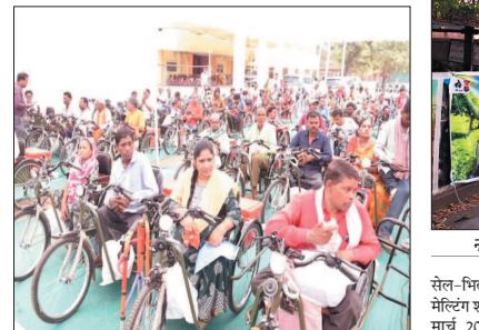
नई दृष्टिबिंदु / भिलाई

(भारतीय कुटुंब अंग निर्माण निगम (एलएमसी) जवल्पुर के सहयोग से मानस भवन (रजिस्टर्ड स्ट्रेडियम के पास) में आयोजित किया गया। विगत दिवस भिलाई-03, नगर पालिका निगम पुर्चला भिलाई और जिला पंचायत परिसर में दिव्यांगजनों के लिए फिजिकल शिबिर लगाए गए थे। साथ ही 18 से 20 फरवरी तक मूल्यांकन एवं परीक्षण शिबिर आयोजित कर पात्र हितग्राहियों का