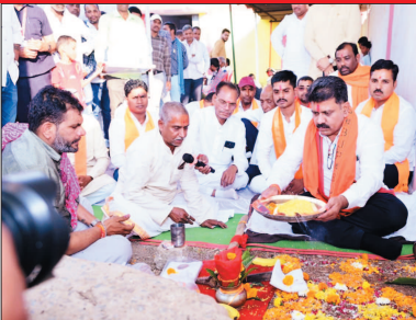
उप मुख्यमंत्री श्री शर्मा ने इस अवसर पर गांव में से चालित विभिन्न विकास कार्यों की जानकारी देते हुए बताया कि प्रधानमंत्री आवास योजना के तहत पात्र हितग्राहियों को आवास स्वीकृत किए जा रहे हैं। उन्होंने बताया कि सरकार ने अपने वादे के अनुरूप गठन के साथ ही कैबिनेट की पहली बैठक में आवास योजना को स्वीकृत देकर इसे प्राथमिकता दी है। उन्होंने कहा कि ग्रामीणों को योजनाओं के तहत मिली राशि गांव में ही आसानी से मिल सके, इसके लिए ग्राम पंचायत भवन में डिजिटल सुविधा केंद्र से चालित किया जा रहा

यह महत्वाकांक्षी परियोजना क्षेत्र के किसानों के लिए वरदान साबित होगी। कार्य पूर्ण होने पर कुल 1540 एकड़ क्षेत्र में सुचारू सिंचाई सुविधा उपलब्ध हो सकेगी तथा 6 गांवों के 800 से अधिक किसानों को सीधा लाभ मिलेगा। नहरों के सुदृढीकरण से जल का अपव्यय रुकेगा, अंतिम छोर तक पानी पहुंचेगा और खेती-किसानों को नई मजबूती मिलेगी। इस दौरान उप मुख्यमंत्री ने सारंगपुर गांव के किसानों के लिए 41 लाख रुपये की सीसी रोड निर्माण और गांव के मेन चौक में भव्य डैम निर्माण की घोषणा की।