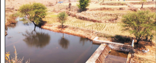
नई दृष्टि बिंदु / मनेन्द्रगढ़-चिरमिरी-भरतपुर

संरक्षण के रूप में सामने आया है। चेक डैम में संचित पानी से भुजल रहने में सुचारू की उम्मीद है। किसान आर सौर पन के जरिए रिचार्ज कर रहे हैं, जिससे खेती की लागत घटी है और उत्पादन में वृद्धि की संभावना बनी है। मनेन्द्रगढ़ और डीएफएम के अर्थ अभिसरण ने यह साबित कर दिया है कि योजनाओं का समन्वित क्रियान्वयन किस तरह ग्रामीण अर्थव्यवस्था को मजबूत कर सकता है। एफओ जहां निगमों के दौरान रोजगार मिला, वहां दूसरी ओर स्थानीय जल नये किसानों को आत्मनिर्भर बनने की दिशा में आगे बढ़ाया है। ग्राम पंचायत बजट का यह चेक डैम अब अन्य ग्राम प्रजायतों के लिए एक आदर्श उदाहरण बन गया है।