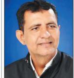
नई दृष्टिबिंदु / दुर्ग

छत्तीसगढ़ राज्य सरकार की महत्वाकांक्षी सार्वजनिक वितरण प्रणाली (पीडीएच) में केवायसी की अनियमितताओं अब गरीब राशन कार्डधारी परिवारों के लिए बड़ी समस्या बनते जा रही हैं। तकनीकी खामियों और प्रक्रिया संबंधी दिक्कतों के कारण कई पात्र परिवारों को समय पर राशन नहीं मिल पा रहा है, जिससे उनकी रोजगारों की जरूरतें प्रभावित हो रही हैं। केवायसी प्रक्रिया में सबसे अधिक परेशानी परिवार के छोटे बच्चों और बुजुर्ग सदस्यों के सत्यापन को लेकर सामने आ रही है।