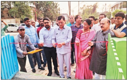
दिशा में नित नये आयाम स्थापित किये जा रहे हैं, एक ओर जहाँ शहर की स्वच्छता पर

उद्घेखनीय है कि नगर पालिका निगम कोरावा द्वारा शहर की व्यवस्थाओं का सुव्यवस्थित करने के साथ-साथ शहर का सौंदर्यीकरण कर इसे संजाने, संवारेने की