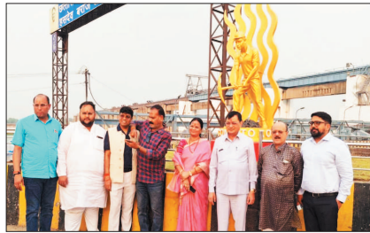
पूरा फोकस रखा जा रहा है, वहीं दूसरी ओर थीम आधारित पेंटिंग, चित्रकारी, लघु

उद्यानिकी थीम आधारित रोड साईड प्लांटेशन पर कार्य किया जा रहा है।